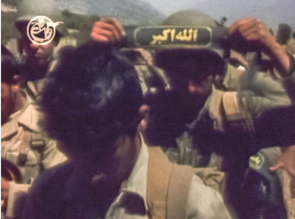
Abb. 3: Film still. „Hanabandan“ in der Reihe Revayat-e Fath, Episode 2, Folge 2, 00:25:20.

Oh Bruder! Weißt du, dass der Weg, den du betreten hast, ein Pfad ist, der in der Hölle beginnt und ins Paradies führt? Es gibt die Wahl zwischen zwei Wegen im Diesseits. Und nach dem Tod wirst du nach dem Weg beurteilt, den du in der diesseitigen Welt betreten hast. 72