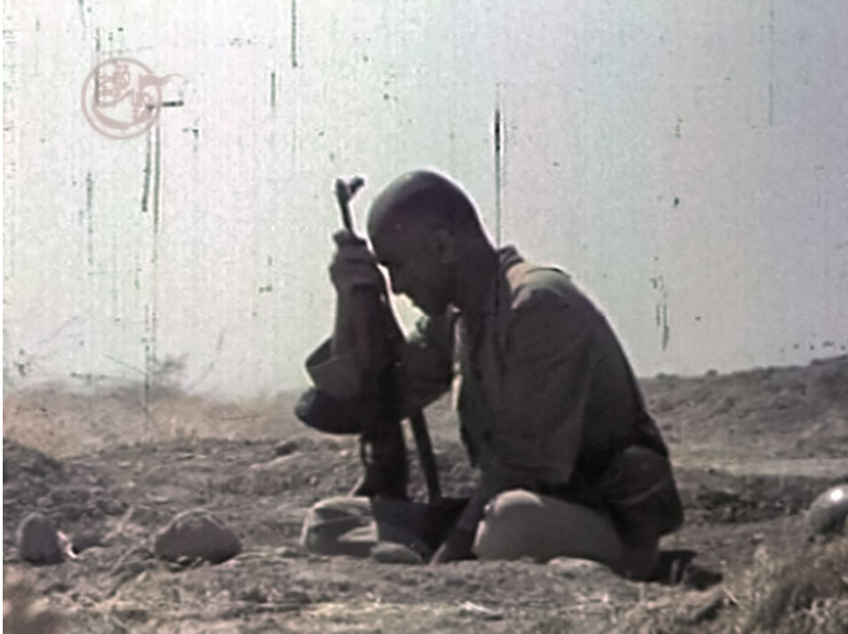
Abb. 5: Film still. „Payam-e basiji” in der Reihe Revayat-e Fath, Episode 2, Folge 3, 00:43:25.

gibt und sich selbst zu opfern bereit ist, wird zur eigentlich heroischen Pose und ersetzt die mit Prahlerei geschminkte (männliche) Geste, die Simone Weil beschreibt. Die Pose des Mannes versinnbildlicht die Übertragung des Heroismus des heroischen Kollektivs der Revolutionsgarden in das kollektive Heldentum, das die iranische Kriegspropaganda entwarf. Nicht mehr die Interessen des Einzelnen sollten zählen, wie noch zu Beginn des Krieges, als die Maskulinitätskonfigurationen die Verteidigung bekannter Entitäten einforderten, sondern im Gegenteil, wie es am Ende der Dokumentation heißt: „Nein Bruder! Wir sorgen uns um nichts anderes als um Religion und Glauben. Um nichts! Nicht Familie, nichts Materielles, nichts!“ 80