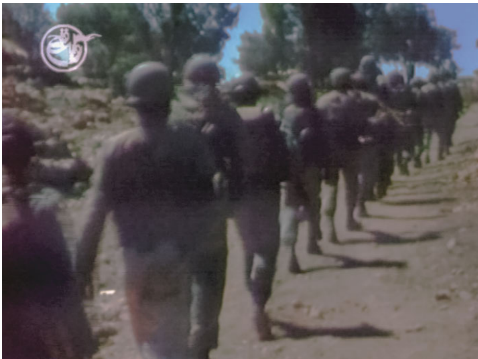
Abb. 4: Film still. „Hanabandan“ in der Reihe Revayat-e Fath, Episode 2, Folge 2, 00:25:30.

den Kampf der Revolutionsgarden als Aktivität einer Avantgarde in der ewigen Auseinandersetzung zwischen Gut und Böse präsentierten. Eine Auseinandersetzung, die nun stellvertretend von dieser Avantgarde von den Unterdrückten für die Unterdrückten geführt wird und die Geschichte der Unterdrücker herausfordert. Die Geschichte wird also neu geschrieben und dies ist der eigentliche Zweck der Revolutionsgarden: Sie erschaffen eine bessere Zukunft, in der die gottgewollte Ordnung entstehen soll. Da diese Ordnung aber als von den Ungläubigen bedroht gilt, geht es eigentlich um die Verteidigung jener besseren Zukunft, die Gott kennt und will, sodass sich der Zirkel bezüglich der Notwehrdiskurse schließt, welche die Heroismen der Revolutionsgarden prägen.