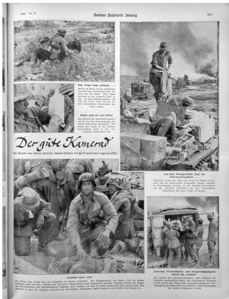
Abb. 3: „Der gute Kamerad“, in: Berliner Illustrierte Zeitung 51.30, 30. Juli 1942, S. 423.

Wie schmal die Grenze zwischen Held-Sein und Eines-Helden-Bedürfen verläuft, verdeutlicht vor allem eine zweite Gruppe an Fotografien, die als Motiv verwundete Soldaten im Verbund mit der Kameradschaft der Unverwundeten versammelt. 40 Dies ist beispielsweise in dem Bildbericht Der gute Kamerad vom Juli 1942 über die Arbeit der Sanitäts-Soldaten der Fall (Abb. 3). 41 Im Vordergrund steht