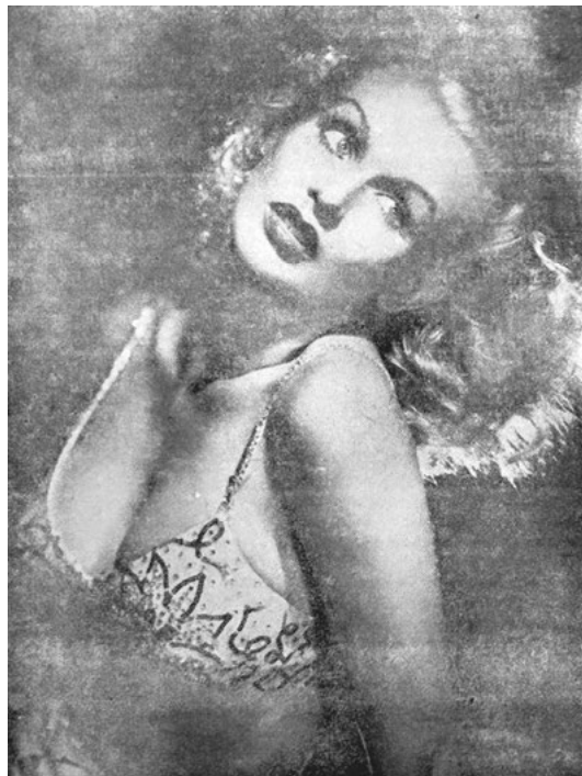
Abb. 7: (1) „Frauen im Sowjet-Paradies“, in: Die junge Dame 9.26, 29. Juli 1941, S. 2. (2) „Die deutschen Rot-Kreuz-Schwester wirken heute in ganz Europa – zu Wasser, zu Lande und in der Luft“, in: Die junge Dame 9.19, 13. Mai 1941, S. 2. (3) „Je mehr sie auszieht, umso anziehender ist sie“, in: Der Durchbruch. Soldatenzeitung an der Westfront 10.12, o. S.