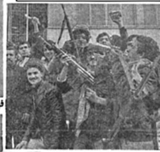
فهرمانانہ به پیروزی رسیدند...