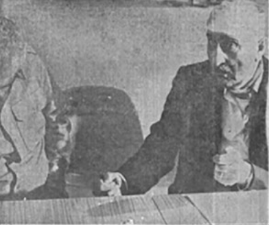
مجلسی که مردم دستگیرشان کردند

جزئیات حوادث تاریخ سبز، در روز ۱۲ بهمن ۱۳۵۷ در تهران شهید شدند. در آن روز، فوجی از ارتش شاهنشاهی در محله کورستان با نیروهای فدایی مبارز درگیر شد. در جریان نبرد، فوجی از ارتش کشته شد و فوجی دیگر زخمی شد. فوجی دیگر نیز در محله کورستان شهید شدند.