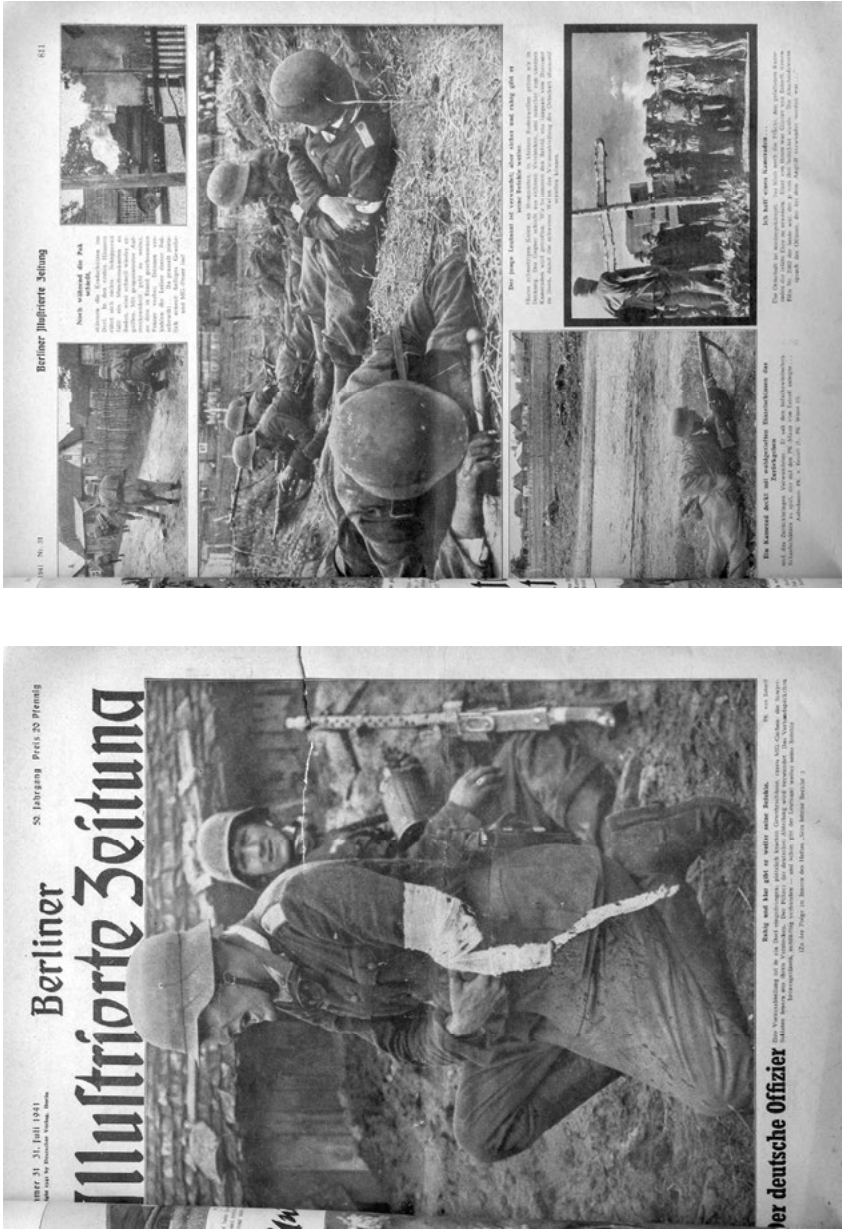
Abb. 2: (1) „Der deutsche Offizier“, in: Berliner Illustrierte Zeitung 50.31, 31. Juli 1941, S. 809. (2) „Sein letzter Bericht“, in: Ebd., S. 811.