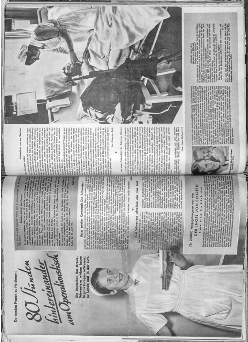
Abb. 6: „Da werden Frauen zu Heldinnen: 80 Stunden hintereinander am Operationstisch“, in: Die junge Dame 9.19.13. Mai 1941, S. 2-3.