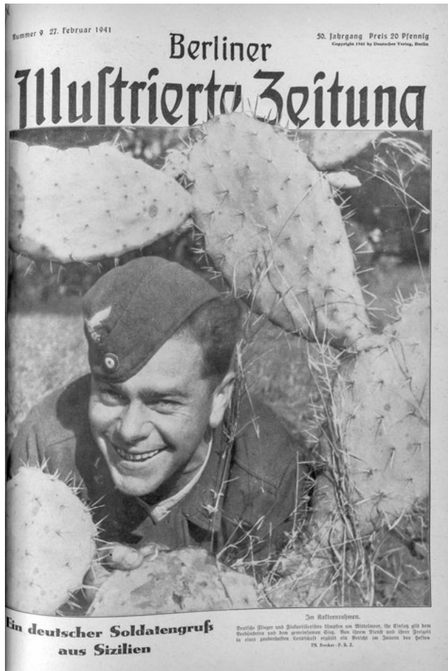
Abb. 1: „Ein deutscher Soldatengruß aus Sizilien“, in: Berliner Illustrierte Zeitung 50.9, 27. Februar 1941, S. 225.

diesem Beitrag untersuchten dokumentarischen Fotografien von Frontsoldaten dieser Zeit aber scheinen gegen all dies fast schon alltäglich. Sie erinnern, wie etwa die Fotografie eines zwischen großen Kakteen hervorschauenden, fröhlich grinenden Soldaten auf der Titelseite der BIZ vom 27. Februar 1941, eher an den sympathischen Nachbarn, Bruder, Freund oder Geliebten, als dass sie Merkmale einer wie auch immer gearteten Außerordentlichkeit anbieten würden (Abb. 1).