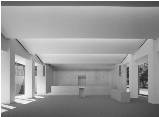
Abb. 45: Bundesverfassungsgericht, Dienstsitz Waldstadt (2011-2014), Sitzungsaal

dem die Verglasung nach außen, also vor die Stützen“ gesetzt wurde. „Dieser simple Schritt verhalf zu einem visuell großzügigeren und luftigeren Eindruck des ansonsten relativ engen Raums.“ Zugleich gelang es damit, die Transparenz des Baumgarten-Baus auch im Übergangsquartier architektonisch auf wirkungsvolle Weise symbolisch in Szene zu setzen. „Selbstverständlich“, so die Architekten, „diente auch die Neugestaltung der Wandverkleidungen, der Beleuchtung und Belichtung und der Bodenbeläge dem Ziel, nicht nur den geforderten Funktionen, sondern gerade der Konversion der ehemaligen Stabsgebäude ... zum Bundesverfassungsgericht gerecht zu werden.“ Die unaufdringliche Gestaltung kommt auch in der Wahl der Materialien und der Farbgebung zum Ausdruck. „Birkefurnier und weiß lackierte MDF-Platten, die als Schatullen ausgebildet sind, sorgen für eine angenehme Raumatmosphäre“, 258 und auch der als Kontrast zur vergleichsweise schlichten Architektur gewählte grüne Teppichboden sollte Freundlichkeit ausstrahlen. Insgesamt war den Architekten mit sparsamen Mitteln eine erstaunliche Übernahme der Grundstruktur des Sitzungssaals im Baumgarten-Bau gelungen, die von den Richtern sowohl im Hinblick auf ihre Arbeit als auch unter dem Blickwinkel der Fortführung einer bewährten Tradition wertgeschätzt wurde. 259