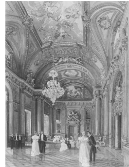
Abb. 38: Reichsgericht Leipzig (Ansicht um 1900)