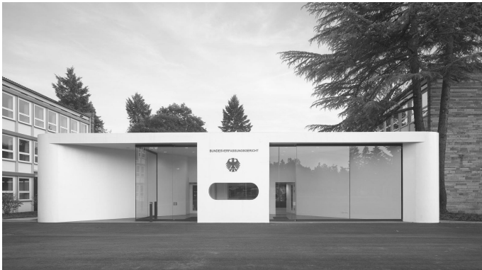
Abb. 44: Bundesverfassungsgericht, Dienstsitz Waldstadt (2011-2014), Eingangsbäude

klar zu kennzeichnen“ 254 (Abb. 44). Damit erscheint der Eingang zum Freiraum hin „sehr viel großzügiger, was nicht ganz unwichtig ist, da das Gericht nur in einem Teil der weitläufigen Anlage untergebracht ist. Somit ist der Eingang schon von weitem erkennbar prägnant in Szene gesetzt. Folgerichtig wird er von den Fernsehkorrespondenten gerne als Hintergrund für ihre ‚Aufsager‘ benutzt“, 255 zumal auf der Front des ebenfalls in Weiß gehaltenen neuen Eingangs in nüchtern schlichtem und zugleich würdevollem Schwarz neben dem Bundesadler als einziges Wort in grafisch einprägsamem Design der Schriftzug „Bundesverfassungsgericht“ angebracht war. Die Wahl der Farbe Weiß als Anstrich von Pförtnerhäuschen, neuem Eingangsbereich und Sitzungsgebäude wie auch die unter starker Betonung rechter Winkel ausgestalteten Gebäudeteile entsprachen durchaus dem aktuellen Zeitgeschmack, der bei öffentlichen Gebäuden wie auch im Eigenheimbau vermehrt Anleihen an der Farb- und Formgebung der Bauhaus-Siedlungen (Weißenhof, Dammerstock u.a.) nahm.