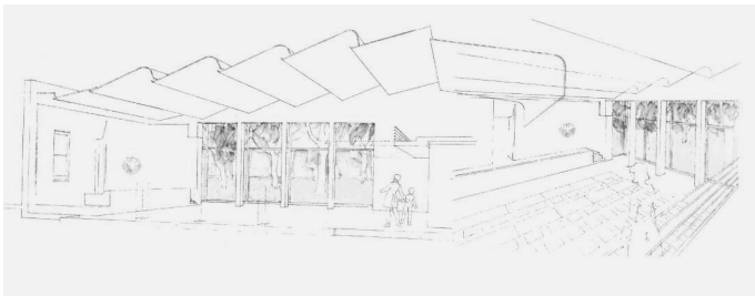
Abb.42 und 43: Lederer, Ragnarsdóttir, Oei Entwurf Bundesverfassungsgericht – Dienstsitz Waldstadt Außenansicht und Sitzungssaal