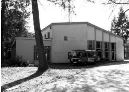
Abb. 41: Casino-Gebäude, Josef-Kammhuber-Kaserne, vor dem Umbau