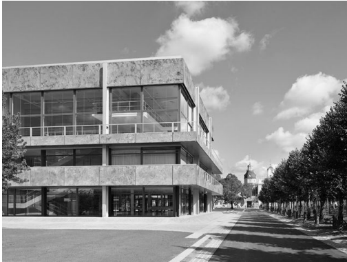
Abb. 40: Paul Baumgarten, Bundesverfassungsgericht, Karlsruhe (1969)

Zur Erhaltung und Modernisierung des denkmalgeschützten Ensembles waren ab 2011 umfangreiche Baumaßnahmen erforderlich. 232 Da das Gericht seine Tätigkeit während der Renovierungszeit nicht unterbrechen konnte, stellte sich für den Zeitraum von 2011–2014 die Frage nach einem adäquaten Übergangsquartier. In der Geschichte des Bundesverfassungsgerichts ist dieser temporäre Dienstsitz kaum mehr als ein kurzes Intermezzo. Für die Frage nach der Symbolisierung von Recht in der Gerichtsarchitektur ist der Übergangsbau – in den die sechzehn Richter beider Senate, ihre mehr als 60 wissenschaftlichen Mitarbeiter, das Vorzimmer-Personal, der Direktor, der Präsidialrat und die Pressestelle des Gerichts (insgesamt rund 120 Personen) umgezogen waren, wohingegen die Bibliothek und die im angrenzenden Schloss untergebrachte Verwaltung mit in etwa gleich vielen Mitarbeitern und Mitarbeiterinnen an ihren angestammten Orten blieben – jedoch von besonderem Interesse. Gerade weil es sich bei ihm um ein Provisorium gehandelt hat, das in Zeiten knapper Haushaltsmittel der Sparsamkeit verpflichtet war, lässt sich an ihm besonders deutlich ablesen, wie viel an Symbolkraft für notwendig erachtet wird, um den Sitz eines so mächtigen Gerichts wie des Bundesverfassungsgerichts nach außen anzuzeigen und in seinem Inneren zu symbolisieren. Denn „auch der architektonisch Unbewanderte wird eine Kaserne nicht mit dem höch-