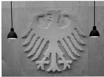
Abb.46: Bundesverfassungsgericht, Dienstsitz Waldstadt (2011-2014), LED-Bundesadler