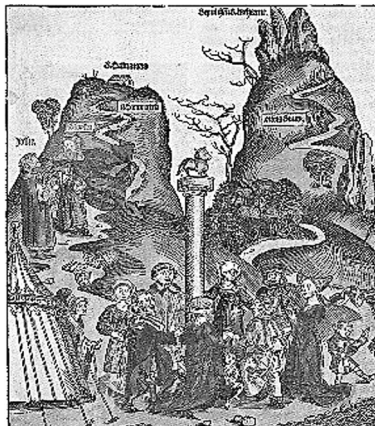
Abb. 3: Biblisches Götzenbild des Goldenen Kalbes in Hartmann Schedels Weltchronik (Nürnberg 1493) 136

Absolutismus und mit einem Höhepunkt in der Französischen Revolution . „Le bonheur est une idée neuve en Europe!“ bekräftigt Saint-Just, der junge Revolutionär und Freund Robespierres, in einer Rede vor dem Konvent 1794: „Europa soll erfahren, dass ihr auf französischem Territorium weder einen Unglücklichen noch einen Unterdrücker mehr sehen wollt, dass dieses Beispiel auf der Erde Früchte trage und die Liebe zur Tugend und das Glück ausbreite! Das Glück ist ein neuer Gedanke in Europa!“ Das allgemeine Glück wird im ersten Entwurf zur französischen Verfassung von 1793 zum ersten Ziel der Gesellschaft: „Le but de la société est le bonheur commun“. Sie trat jedoch nie in Kraft, die blutige Terrorherrschaft des Comité de Salut Public , des Wohlfahrtsausschusses , kam ihr zuvor und übernahm tatkräftig die Sorge für die „öffentliche Wohlfahrt“.