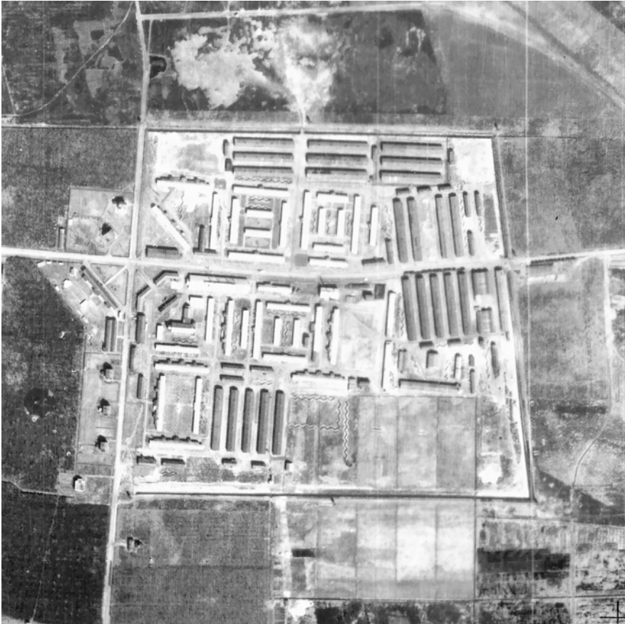
Abb. 10 Luftbild 22. März 1945, GSGS 4427.

Das Lager Westerbork liegt in einem der am dünnsten besiedelten Teile der Niederlande, nördlich des Oranje Kanals in einer kargen Heidelandschaft und umfasst in seiner endgültigen Ausdehnung eine Fläche von knapp 500 mal 500 Metern. Da sich weder Städte noch größere Industrieanlagen in der Nähe befinden, handelt es sich um eine der wenigen Gegenden in Europa, die 1943 und 1944 nicht von der alliierten Luftaufklärung fotografiert werden. 52 Es gibt daher nur eine Luftaufnahme vom 22. März 1945, die im Rahmen der Operation Geographical Section General Staff (GSGS) 4427 angefertigt wurde. 53 Im NIOD haben sich