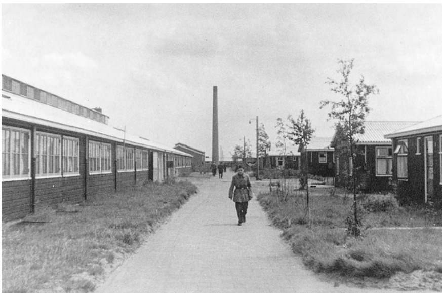
Abb. 15 Links die Großküche, im Hintergrund der Schornstein des Kesselhauses.