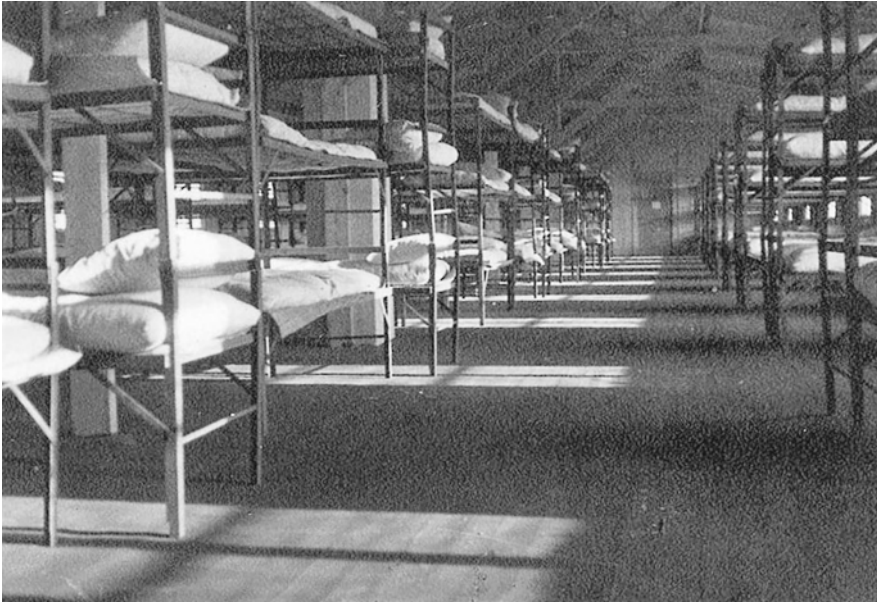
Abb. 17 Eine der 1942 von der SS gebauten Baracken.