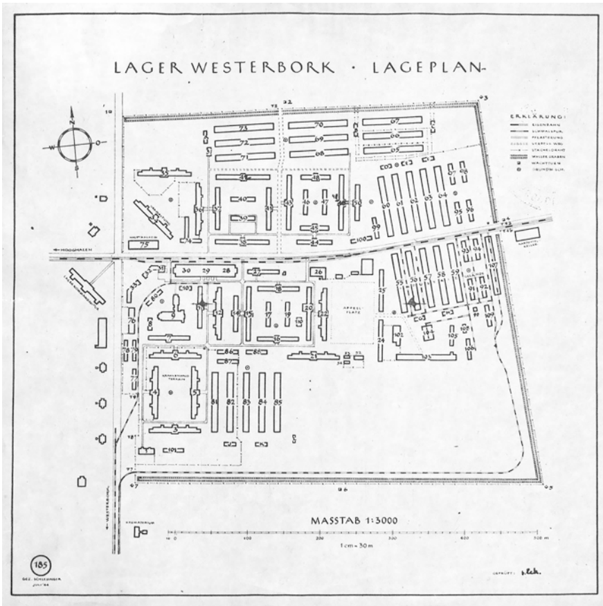
Abb. 9 Lageplan Juli 1944; »gez. Schlesinger«.

zum Schein die Rechtsstaatlichkeit gewahrt wird. 50 In der Regel firmiert die Einrichtung unter dem Namen »Lager Westerbork«. In einem Brief der Haushaltsabteilung des Reichskommissars für die besetzten niederländischen Gebiete Seyss-Inquart wird erstmals die Bezeichnung »Judendurchgangslager« verwendet und danach gefragt »wie lange [...] das Lager Westerbork voraussichtlich noch als Judendurchgangslager in Anspruch genommen werden [wird]«. 51