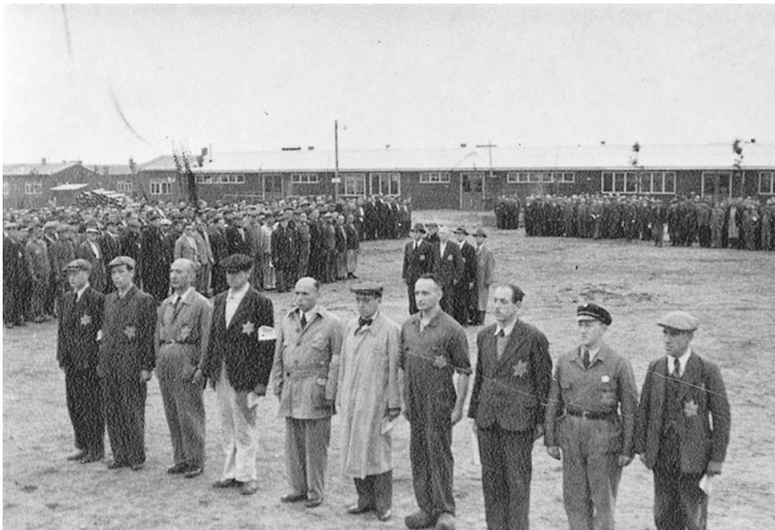
Abb. 14 Der Appellplatz (später Fußballplatz).