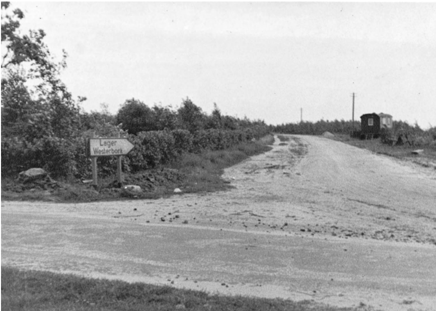
Abb. 12 Wegweiser zum Lager.