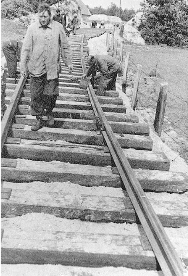
Abb. 16 Sept. 1942, das Bahngleis ins Lager wird gebaut.

1943 ihre Tätigkeit aufnimmt und prominent im Film zu sehen ist. Diese Abteilung besteht anfangs aus 14 Personen und ist nur für die Sammlung von Papier, Metall, Glas, Leder und Textilien sowie für die lagerweite Mülltrennung verantwortlich und wird »zur Vermeidung einer weiteren Entwertung der verwertbaren Abfälle« eingerichtet. Küchenabfälle kommen als Tierfutter in die Landwirtschaft und der sonstige Abfall wird gesammelt und sortiert. Die Abteilung Abfallverwertung ist nur für das Recycling zuständig. 75 Für die Müllabfuhr gibt es eine separate Gruppe (Lagerreinigung, Gruppe Unger).