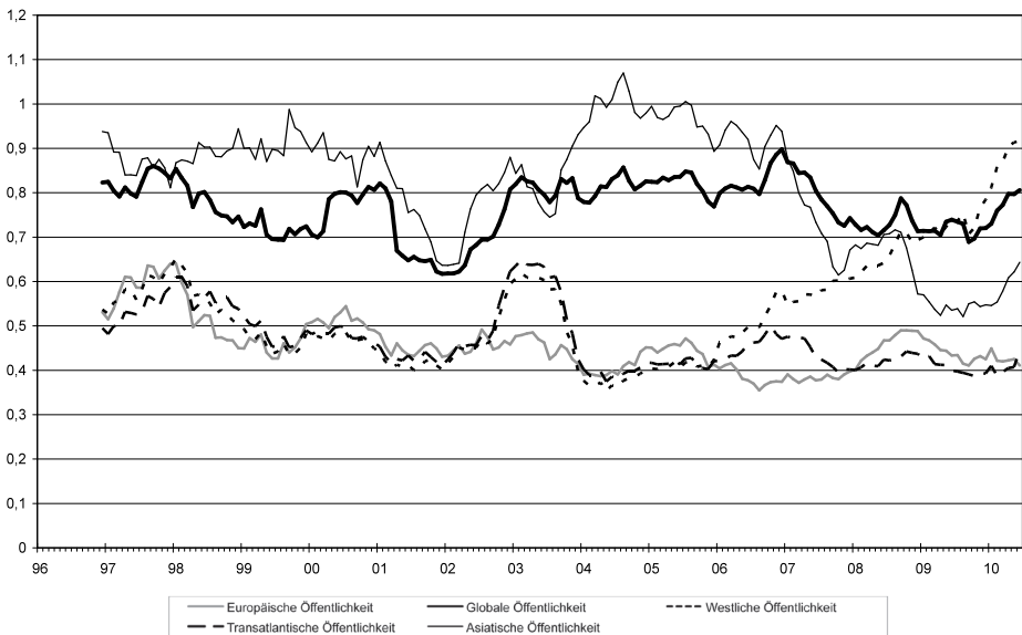
Abbildung 3: Variationskoeffizienten der Ländergruppen im Zeitverlauf. Dargestellt sind die gleitenden, zwölfmonatigen Durchschnitte der jeweiligen Ländergruppen (Öffentlichkeiten)

Bleibt die Frage nach einer globalen Öffentlichkeit. Diese scheint nicht sehr ausgeprägt. Verglichen mit der europäischen respektive transatlantischen Öffentlichkeit zeigen sich weder im Niveau (Variationskoeffizient 0,77) noch in den Aufmerksamkeitsverläufen (durchschnittliche Korrelation 0,252) nennenswerte Übereinstimmungen. Unsere Querschnittsbetrachtung deutet also eher auf eine auf Europa und Nordamerika bzw. die westliche Welt beschränkte transnationale Öffentlichkeit hin und nicht auf eine globale.