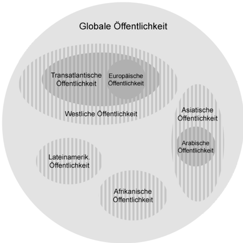
Abbildung 1: Auswahl der konzeptionell unterscheidbaren Reichweiten transnationaler Öffentlichkeit

ischen Länder beinhalten („europäische Öffentlichkeit“), zweitens zusätzlich die USA und Kanada („transatlantische Öffentlichkeit“, Wessler et al., 2008, S. 9) oder drittens alle westlichen Länder umfassen („westliche Öffentlichkeit“, wobei zum „Westen“ neben Westeuropa und Nordamerika recht konsensuell auch Australien und Neuseeland gezählt werden, vgl. Inglehart, 1997; Toynbee, 1966; UNDP, 2007). Dem lässt sich viertens die Möglichkeit regionaler Transnationalisierungsprozesse jenseits