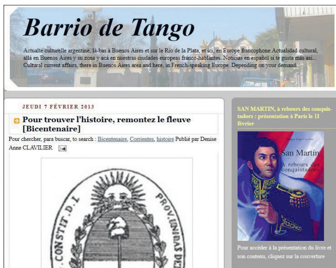
Figure 1 : http://www.barrio-de-tango.blogspot.de/ (07.02.2013)