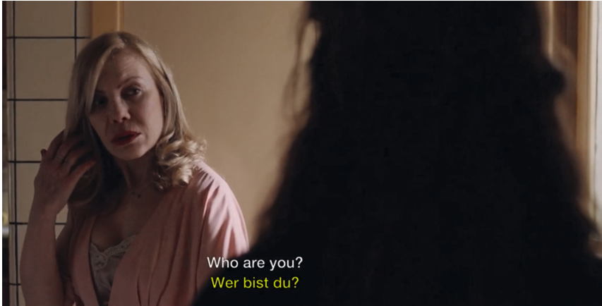
Img. 3: EL PRÓFUGO (2020): La madre prófuga.

Inés se da cuenta de que no es su madre y la amenaza con una plancha ardiente para que se vaya. En este momento irrumpe la vecina Nancy, pero ella solo ve a Inés con la plancha en la mano – porque Marta, la madre, ha desaparecido, como un fantasma –. Después Inés se enfrenta a Alberto, acusándole de ser un prófugo, al igual que Leonardo y que la señora que dice ser su madre (01:23:00). Ella le pide que se vaya, pero Alberto le dice que la ama y le pregunta por qué no se puede quedar, que hay lugar para los dos (01:24:00). Se besan y ella se le entrega. Vuelve al coro a cantar sin problema, y cuando la cámara enfoca su cara se nota que tiene un ojo marrón y otro azul. Cabe interpretar este final de dos maneras: el cambio del color de sus ojos puede significar que ella se haya convertido asimismo en un prófugo, o, siguiendo las palabras de Alberto, que el prófugo haya logrado entrar en ella, pero que 'compartan' el espacio 25 . La primera interpretación es más cercana al final siniestro de la novela, puesto que Inés comete allí asesinatos atroces dignos de un prófugo antes de suicidarse y finalmente triunfará el mal. Ya que ambas interpretaciones fantásticas son posibles, y que la película carece de una solución, se confirma nuestra modelización de lo fantástico como ambigüedad entre dos realidades narrativas igualmente plausibles, pero que se excluyen mutuamente. 26