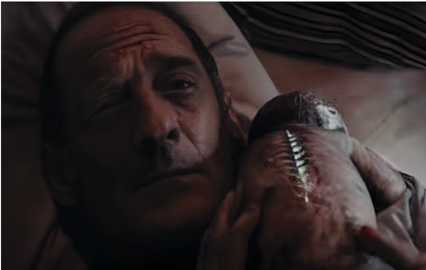
( Img. 11: TITANE (2021): Espina dorsal “metalizada” del hijo de Alexia/Adrien.).

de las sociedades burguesas, casi desde mediados del siglo XIX. Estas líneas no son el lugar para efectuar una profundización en el análisis de los planteamientos ideológicos que circundan este núcleo narrativo; sin embargo, cabe poner en relieve el hecho que es justamente en el ambiente de su huida, allí donde vive con el jefe de bomberos que la toma por su hijo perdido, en donde logra establecer un vínculo afectivo estable, justamente con una persona que resulta requerir de la intervención prostética de las inyecciones de testosterona para asegurarse su supervivencia. De esta manera, el contexto desestructurado que rodea a Vincent, cabeza de un cuerpo de bomberos, quien simbólicamente requiere de un falo prostético para sobrevivir, representa el único espacio donde la alteridad, visual y metafísica, si se quiere, de Alexia alcanza a asentarse y es tolerada de una forma más o menos exitosa. Este hecho alcanza su momento de paroxismo cuando el embarazo de Alexia es imposible de esconder, y toda la ficción que envuelve a su tecnocuerpo, se convierte en insostenible, una secuencia que culmina con Vincent ayudándola a traer al bebé al mundo. Un bebé, éste, que metafóricamente lleva incrustado en su médula espinal la marca de la alteridad, de la aparentemente fructuosa unión entre máquina y humano, entre carne y metal