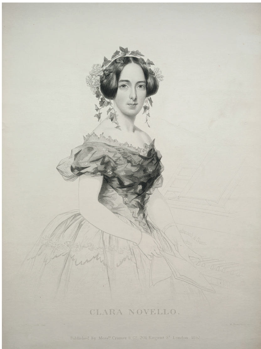
Fig. 2. William Humphreys, Clara Novello , incisione, 1852 - Cleveland, Museum of Art, Collection PR-Stripple Prints

A partire dagli anni Quaranta la programmazione del teatro conosce una svolta qualitativa. Qui s'inserisce la vicenda artistica e politica del soprano Clara Novello, che aveva debuttato con la Semiramide di Rossini nel 1841. 31 Con lei si apre la fase risorgimentale del Teatro dell'Aquila poiché la cantante fu coinvolta attivamente nei moti del 1848 assieme al marito, il conte fermano Giovanni Battista Gigliucci.