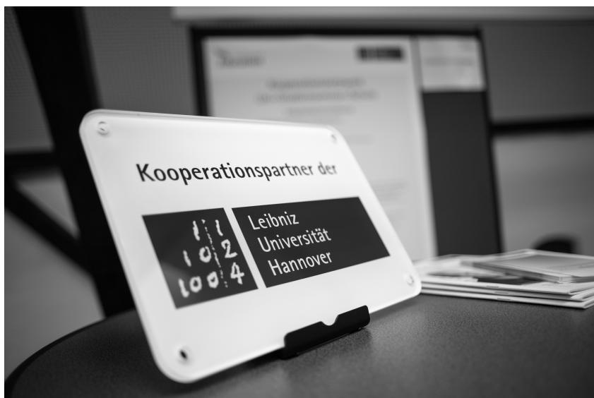
Abb. 2: Kooperationsiegel.

Dies wird ergänzt durch die Zusammenarbeit zwischen Fachwissenschaften, Fachdidaktiken sowie den Bildungswissenschaften innerhalb der LUH . Für eine Intensivierung universitätsinterner Zusammenarbeit und eine gemeinsame inhaltliche und organisatorische Ausgestaltung der Lehrkräftebildung entstand bspw. die Leibniz Konferenz Lehrkräftebildung (LKL) . Anstoß gab die Corona-Pandemie und die damit verbundenen Schulschließungen, die es notwendig machten, Ersatzleistungen für nicht stattfindende oder abgebrochene Schulpraktika zu eruieren. Praktikumsverantwortliche aus Fachdidaktiken, Fachwissenschaften, Erziehungswissenschaft sowie die LSE fanden hier ein Format, sich über Institutsgrenzen hinweg auszutauschen. LSCconnect entwickelte in der Folge schließlich das bereits erwähnte Projekt #LernenVernetzt .