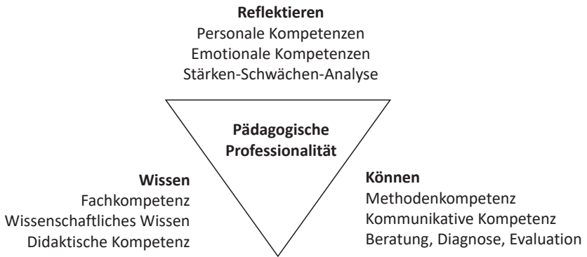
Abbildung 2: Komplexität pädagogischer Professionalität (eigene Darstellung in Anlehnung an Arnold/Gómez-Tutor 2007)

tiale ermöglicht. Diese Reflexion eigener Kompetenzen (vgl. Gillen 2007) führt einerseits die eigenen Kompetenzen vor Augen, im Sinne der Bewusstwerdung derer, und erhöht infolgedessen das Selbstbewusstsein sowie die Selbstwirksamkeit. Andererseits expliziert dies die eigene Kompetenzentwicklung und das eigene (z. T. informelle) Lern- und Arbeitsverhalten und ermöglicht eine systematische Verbesserung dessen (ebd., 536).