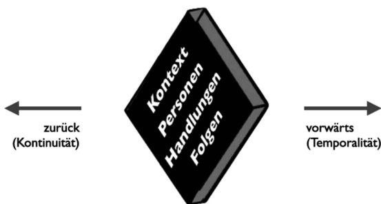
Abbildung 14: Geschichten über Zeit

Alle drei Effekte erhöhen die Dramaturgie von Texten. Der Rückgriff auf rhetorische und stilistische Mittel soll sie aber nicht darin hindern, ihre eigenen Geschichten in didaktischen Texten zu formulieren. In diesem Sinne können die Effekte fortgeschrittenen Erzählenden helfen ihre didaktischen Texte effektvoller oder in anderen Worten noch didaktischer zu formulieren. Alle diese Effekte betreffen die zeitliche Struktur von Texten, weil sie die einzelnen Episoden unterschiedlich ordnen, um dadurch die Dramaturgie von didaktischen Texten zu erhöhen (vgl. Abb. 14).