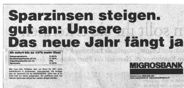
Abbildung 2: Zeitungsinserat

Man ist nach der flüchtigen Lektüre irritiert. Man versteht die Wörter, aber nicht den Satz und will diese Schmach nicht auf sich sitzen lassen. Irgendwann dämmert einem, dass die Zeilen von unten nach oben zu lesen sind. Man freut sich, dass man die Botschaft nun doch verstanden hat, und attestiert dem Plakat eine gewisse Originalität. Damit wird durch den Widerspruch zum Erwarteten die Wahrscheinlichkeit erhöht, dass die Botschaft gelesen und vielleicht sogar behalten wird. Beim zweiten Beispiel handelt es sich um eine TV-Werbung, weshalb ich versuche die Handlung kurz in Worte zu fassen.