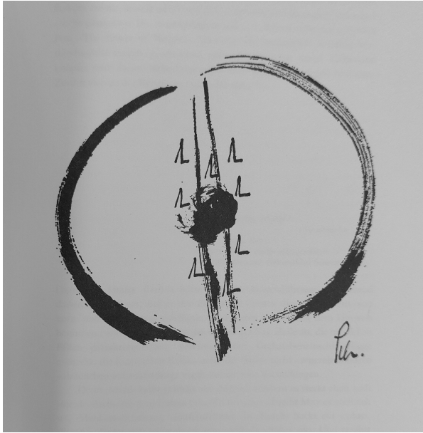
Abb. 4: Gestirn in Schmidts Sitara 36