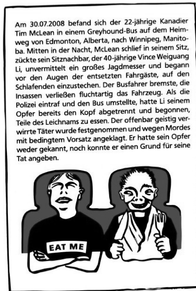
Abb. 2 und 3: Vorder- und Rückseite ›Kopflös durch die Nacht‹

Im Vergleich zu der Auflösung des fiktionalen Krimirätsels zeigen sich hier zahlreiche Unterschiede: Die ›gut recherchierte‹ und im Stil eines Zeitungsberichts präsentierte Auflösung des real crime -Rätsels spart nicht mit Details. Nicht nur die Tat an sich, sondern auch das strafrechtliche Schicksal des Täters und das Verhalten von Busfahrer, Fahrgästen und Polizei werden beschrieben. Der Zusammenhang zwischen Aktion (Wahl des Transportmittels) und Konsequenz (Tod) wird hingegen durch die Erklärung nicht herbeigeführt; anders als im fiktiven Fall, in dem die