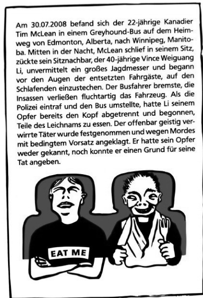
Abb. 2 und 3: Vorder- und Rückseite »Kopflös durch die Nacht«

Im Vergleich zu der Auflösung des fiktionalen Krimirätsels zeigen sich hier zahlreiche Unterschiede: Die »gut recherchierte« und im Stil eines Zeitungsberichts präsentierte Auflösung des real crime -Rätsels spart nicht mit Details. Nicht nur die Tat an sich, sondern auch das strafrechtliche Schicksal des Täters und das Verhalten von Busfahrer, Fahrgästen und Polizei werden beschrieben. Der Zusammenhang zwischen Aktion (Wahl des Transportmittels) und Konsequenz (Tod) wird hingegen durch die Erklärung nicht herbeigeführt; anders als im fiktiven Fall, in dem die