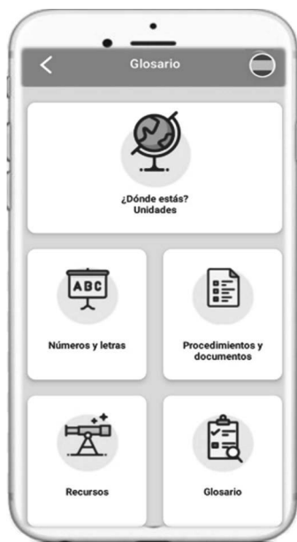
Figura 8: Funcionalidades

to que se entiende que el aprendiz no posee aún los rudimentos básicos del idioma, pero necesita manejar determinados aspectos gramaticales y léxicos que, aunque se enmarcan en un nivel superior, son necesarios para que el usuario pueda desarrollar con éxito los intercambios comunicativos que puedan surgir al llegar a la sociedad de acogida. Por esta razón, 7Ling se aleja de las aplicaciones de enseñanza de idiomas al uso, y toma como punto de partida seis situaciones comunicativas a las que el recién llegado tendrá que enfrentarse: desenvolverse en las primeras interacciones tras la llegada a la nueva sociedad, desplazarse por la ciudad y localizar lugares de interés, adquirir productos y familiarizarse con los principales establecimientos, buscar alojamiento, buscar empleo y acudir al médico.