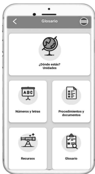
Figura 8: Funcionalidades

to que se entiende que el aprendiz no posee aún los rudimentos básicos del idioma, pero necesita manejar determinados aspectos gramaticales y léxicos que, aunque se enmarcan en un nivel superior, son necesarios para que el usuario pueda desarrollar con éxito los intercambios comunicativos que puedan surgir al llegar a la sociedad de acogida. Por esta razón, 7Ling se aleja de las aplicaciones de enseñanza de idiomas al uso, y toma como punto de partida seis situaciones comunicativas a las que el recién llegado tendrá que enfrentarse: desenvolverse en las primeras interacciones tras la llegada a la nueva sociedad, desplazarse por la ciudad y localizar lugares de interés, adquirir productos y familiarizarse con los principales establecimientos, buscar alojamiento, buscar empleo y acudir al médico.