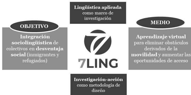
Figura 5: Esquema de organización de 7Ling.

Como hemos señalado, uno de los propósitos fundamentales del proyecto consistía en la creación de materiales virtuales de aprendizaje de lenguas extranjeras que estuvieran disponibles en acceso abierto. Estos materiales estaban concebidos para facilitar el aprendizaje de la lengua del país de acogida, uno de los medios más eficaces de integración que existen, y para continuar avanzando en el desarrollo de la enseñanza digital enfocada a la eliminación de las dificultades de acceso al sistema con el que se encuentran algunos colectivos, en concreto, inmigrantes y refugiados. En este contexto emerge como principal producto de transferencia 7Ling 7 , una aplicación móvil multilingüe que surge de un exhaustivo proceso de investigación impulsado por los miembros del consorcio con el apoyo de instituciones de educación superior egipcias. Esta iniciativa constituye un punto de interés esencial, pues se estructura tomando como referencia los elementos que vertebran esta publicación.