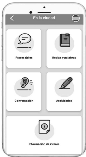
Figura 7: Apartados de cada situación comunicativa

resultan de primer orden para desenvolverse en la sociedad de acogida. El objetivo fundamental era, por tanto, permitir al usuario satisfacer las necesidades comunicativas básicas sin dejar de lado su idiosincrasia específica, así como el contexto personal y social, y sus posibles conocimientos previos. Las características de esta herramienta, fruto de un proceso de investigación-acción, ponen de manifiesto su idoneidad para avanzar en el proceso de integración sociolingüística que la población inmigrante experimenta en la sociedad de acogida (Paredes García 2020). Así, 7Ling se perfilaba como una herramienta: a) funcional, pues parte de un enfoque centrado en la acción con el fin de favorecer un proceso de comunicación eficaz, b) versátil, en la medida en que se adapta a las diferentes necesidades comunicativas inmediatas, y c) autónoma, ya que es el propio usuario el que gestiona el proceso de aprendizaje. Son precisamente de estas características de las que se derivan las principales ventajas de uso de la aplicación, entre las que señalamos el dinamismo, la flexibilidad y la accesibilidad.