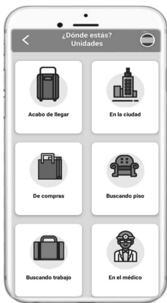
Figura 6: Menú principal de 7Ling : Situaciones comunicativas

Esta idea, surgida en el contexto de la crisis general de refugiados sirios y de otros países arabófonos, como Libia, que tuvo lugar durante 2015 y 2016, buscaba promover la integración sociolingüística de estos colectivos mediante el aprendizaje móvil de nociones del idioma básicas para desenvolverse en la llegada a un país nuevo. 7Ling se enmarcaba en un ámbito educativo alejado de lo ordinario, pues buscaba facilitar el acceso a estos contenidos educativos a los colectivos citados, que, debido a su situación, en ocasiones experimentan dificultades para asistir a clases regladas con regularidad. De este modo, esta herramienta de aprendizaje se insertaba en un contexto en el que crece el interés por emplear este tipo de herramientas digitales en el ámbito de la enseñanza de lenguas a la población inmigrante (Demmans Epp 2017), favoreciendo las oportunidades de aprendizaje de las comunidades a las que se dirige en una realidad que invita a potenciar la educación virtual.