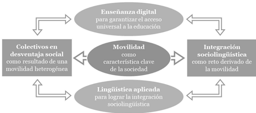
Figura 2: Organización de las acciones de los proyectos elaborados.

Como conclusión de lo dicho hasta aquí mostramos cómo los elementos presentados entran en relación y configuran un todo indivisible, que constituye el eje de trabajo de nuestro equipo de investigación y que surge motivado por los desafíos sociolingüísticos que emanan de este contexto: