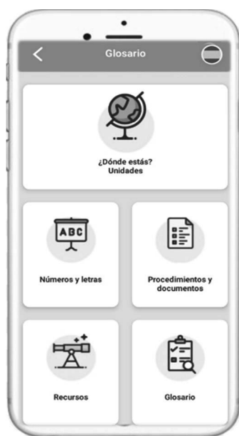
Figura 8: Funcionalidades

to que se entiende que el aprendiz no posee aún los rudimentos básicos del idioma, pero necesita manejar determinados aspectos gramaticales y léxicos que, aunque se enmarcan en un nivel superior, son necesarios para que el usuario pueda desarrollar con éxito los intercambios comunicativos que puedan surgir al llegar a la sociedad de acogida. Por esta razón, 7Ling se aleja de las aplicaciones de enseñanza de idiomas al uso, y toma como punto de partida seis situaciones comunicativas a las que el recién llegado tendrá que enfrentarse: desenvolverse en las primeras interacciones tras la llegada a la nueva sociedad, desplazarse por la ciudad y localizar lugares de interés, adquirir productos y familiarizarse con los principales establecimientos, buscar alojamiento, buscar empleo y acudir al médico.