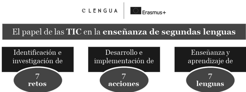
Figura 3: Esquema de acción del proyecto E-LENGUA.

Así, como puede observarse en el gráfico 3, a través de siete acciones, el consorcio propuso una solución a cada uno de los siete retos que planteaba el uso de la tecnología como herramienta educativa en la enseñanza de lenguas extranjeras involucradas (inglés, árabe, español, francés, alemán, italiano y portugués, en este caso). Se trataba de siete productos tangibles y medibles llevados a cabo por las siete universidades asociadas que pueden ayudar a afrontar siete retos que plantea el uso de la tecnología como herramienta educativa en la enseñanza de lenguas extranjeras (inglés, árabe, español, francés, alemán, italiano y portugués).