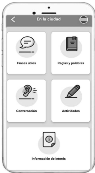
Figura 7: Apartados de cada situación comunicativa

resultan de primer orden para desenvolverse en la sociedad de acogida. El objetivo fundamental era, por tanto, permitir al usuario satisfacer las necesidades comunicativas básicas sin dejar de lado su idiosincrasia específica, así como el contexto personal y social, y sus posibles conocimientos previos. Las características de esta herramienta, fruto de un proceso de investigación-acción, ponen de manifiesto su idoneidad para avanzar en el proceso de integración sociolingüística que la población inmigrante experimenta en la sociedad de acogida (Paredes García 2020). Así, 7Ling se perfilaba como una herramienta: a) funcional, pues parte de un enfoque centrado en la acción con el fin de favorecer un proceso de comunicación eficaz, b) versátil, en la medida en que se adapta a las diferentes necesidades comunicativas inmediatas, y c) autónoma, ya que es el propio usuario el que gestiona el proceso de aprendizaje. Son precisamente de estas características de las que se derivan las principales ventajas de uso de la aplicación, entre las que señalamos el dinamismo, la flexibilidad y la accesibilidad.