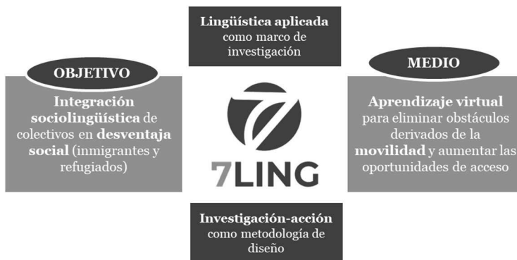
Figura 5: Esquema de organización de 7Ling.

Como hemos señalado, uno de los propósitos fundamentales del proyecto consistía en la creación de materiales virtuales de aprendizaje de lenguas extranjeras que estuvieran disponibles en acceso abierto. Estos materiales estaban concebidos para facilitar el aprendizaje de la lengua del país de acogida, uno de los medios más eficaces de integración que existen, y para continuar avanzando en el desarrollo de la enseñanza digital enfocada a la eliminación de las dificultades de acceso al sistema con el que se encuentran algunos colectivos, en concreto, inmigrantes y refugiados. En este contexto emerge como principal producto de transferencia 7Ling 7 , una aplicación móvil multilingüe que surge de un exhaustivo proceso de investigación impulsado por los miembros del consorcio con el apoyo de instituciones de educación superior egipcias. Esta iniciativa constituye un punto de interés esencial, pues se estructura tomando como referencia los elementos que vertebran esta publicación.