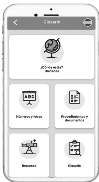
Figura 8: Funcionalidades

to que se entiende que el aprendiz no posee aún los rudimentos básicos del idioma, pero necesita manejar determinados aspectos gramaticales y léxicos que, aunque se enmarcan en un nivel superior, son necesarios para que el usuario pueda desarrollar con éxito los intercambios comunicativos que puedan surgir al llegar a la sociedad de acogida. Por esta razón, 7Ling se aleja de las aplicaciones de enseñanza de idiomas al uso, y toma como punto de partida seis situaciones comunicativas a las que el recién llegado tendrá que enfrentarse: desenvolverse en las primeras interacciones tras la llegada a la nueva sociedad, desplazarse por la ciudad y localizar lugares de interés, adquirir productos y familiarizarse con los principales establecimientos, buscar alojamiento, buscar empleo y acudir al médico.