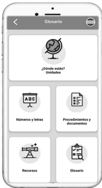
Figura 8: Funcionalidades

to que se entiende que el aprendiz no posee aún los rudimentos básicos del idioma, pero necesita manejar determinados aspectos gramaticales y léxicos que, aunque se enmarcan en un nivel superior, son necesarios para que el usuario pueda desarrollar con éxito los intercambios comunicativos que puedan surgir al llegar a la sociedad de acogida. Por esta razón, 7Ling se aleja de las aplicaciones de enseñanza de idiomas al uso, y toma como punto de partida seis situaciones comunicativas a las que el recién llegado tendrá que enfrentarse: desenvolverse en las primeras interacciones tras la llegada a la nueva sociedad, desplazarse por la ciudad y localizar lugares de interés, adquirir productos y familiarizarse con los principales establecimientos, buscar alojamiento, buscar empleo y acudir al médico.