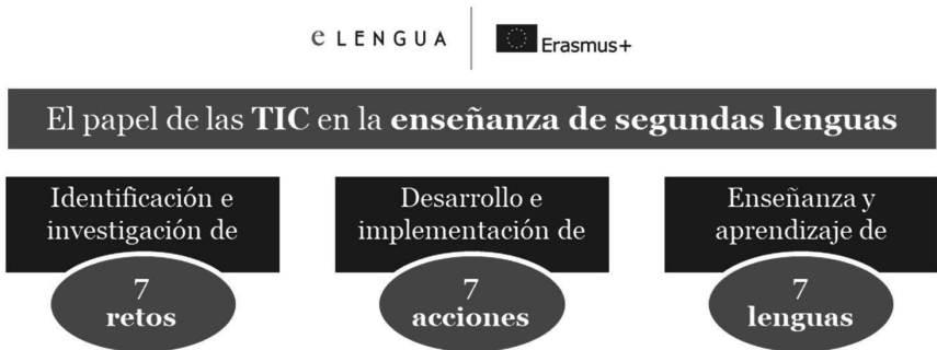
Figura 3: Esquema de acción del proyecto E-LENGUA.

Así, como puede observarse en el gráfico 3, a través de siete acciones, el consorcio propuso una solución a cada uno de los siete retos que planteaba el uso de la tecnología como herramienta educativa en la enseñanza de lenguas extranjeras involucradas (inglés, árabe, español, francés, alemán, italiano y portugués, en este caso). Se trataba de siete productos tangibles y medibles llevados a cabo por las siete universidades asociadas que pueden ayudar a afrontar siete retos que plantea el uso de la tecnología como herramienta educativa en la enseñanza de lenguas extranjeras (inglés, árabe, español, francés, alemán, italiano y portugués).