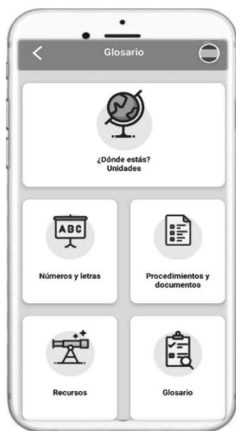
Figura 8: Funcionalidades

to que se entiende que el aprendiz no posee aún los rudimentos básicos del idioma, pero necesita manejar determinados aspectos gramaticales y léxicos que, aunque se enmarcan en un nivel superior, son necesarios para que el usuario pueda desarrollar con éxito los intercambios comunicativos que puedan surgir al llegar a la sociedad de acogida. Por esta razón, 7Ling se aleja de las aplicaciones de enseñanza de idiomas al uso, y toma como punto de partida seis situaciones comunicativas a las que el recién llegado tendrá que enfrentarse: desenvolverse en las primeras interacciones tras la llegada a la nueva sociedad, desplazarse por la ciudad y localizar lugares de interés, adquirir productos y familiarizarse con los principales establecimientos, buscar alojamiento, buscar empleo y acudir al médico.