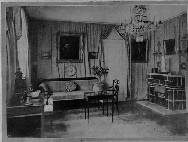
ECKE IM BIBLIOTHEKZIMMER