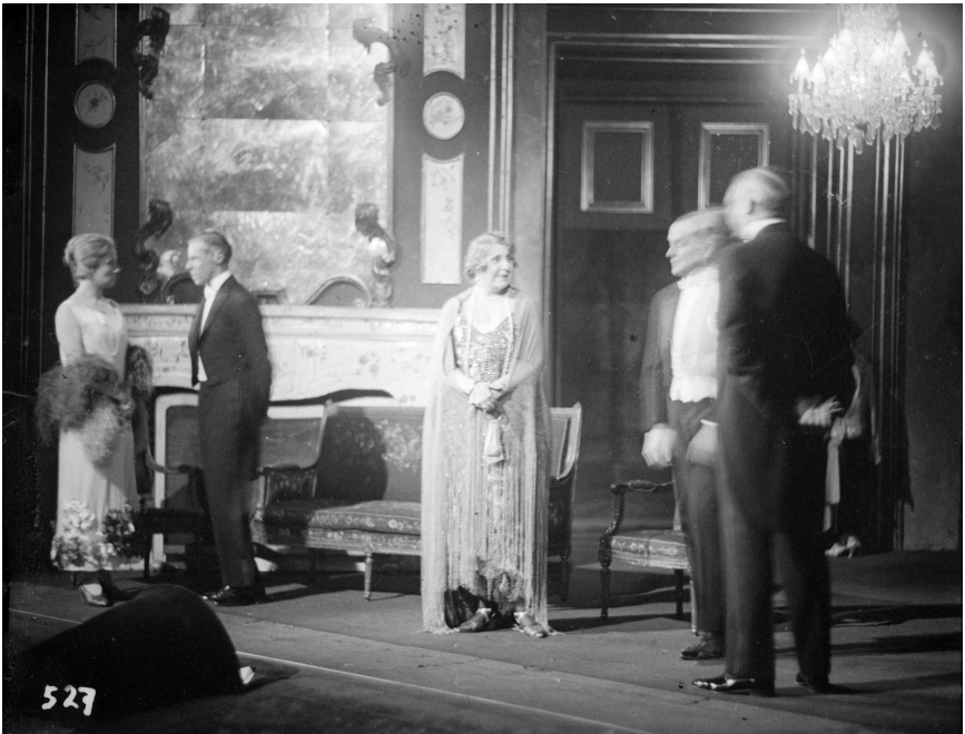
Abb. 4: Bühnenbild »Der Schwierige«, Akt II Foto: Hans Böhm, ÖNB, Pk 2788,327

Das aristokratische Flair des kleinen Salons bringt Strnads detailgetreues Bühnenbild hervor durch marmorvertäfelte Wände, Stuckverzierungen, Kronleuchter, Kassettentüren, einen Kamin mit geschwungenem Fries in barockem Stil sowie durch ausschließlich historisch anmutendes Mobiliar, wobei sich in der Ausstattung ebenfalls mehrere Stile oder Stilanklänge (von Louis Seize bis Biedermeier) mischen. Auch dieses Interieur ist in keiner Weise individualisiert, es bietet lediglich den passenden repräsentativen Hintergrund für die gesellschaftlichen Gepflogenheiten. Das Interieur ermöglicht diese Gepflogenheiten nicht nur, es konserviert sie.