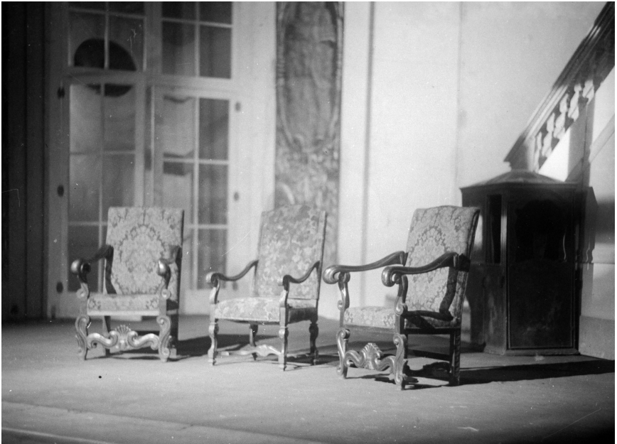
Abb. 5: Bühnenbild »Der Schwierige«, Akt III Foto: Hans Böhm, ÖNB, Pk 2788,338

Nach verschiedenen emotionalen und auch räumlichen Umwegen zwischen Akt II und Akt III – nach Hans Karls detour durch die Stadt und Helenes Entschluss, das Haus zu verlassen, um ihm auf die Straße hinaus nachzugehen – kommen im dritten Akt die Aussprache und Verlobung zwischen Hans Karl und Helene in einem Raum zustande, der eigentlich und erst recht in einer Salonkomödie nicht für ein solches Ereignis vorgesehen ist, nämlich im Eingangsbereich des Palais Altenwyl, nicht im Salon. Helene spricht die ungewöhnliche räumliche Situation direkt an (»[...] hier ist vielleicht nicht der rechte Ort, das zu sagen, was gesagt werden muß«), arrangiert sich aber sofort mit diesem Setting: »[...] aber jetzt muß es halt hier gesagt werden.« (III,8, S. 129f.)