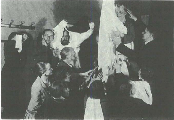
Abb. 3 Theodor Däubler bei einer spiritistischen Sitzung

ze 49 , den Frühexpressionisten waren sie vertraut 50 , Kafka verkehrte mit Werfel, Kornfeld, Brod und anderen in einem Spiritistenzirkel 51 , Thomas Mann hat entsprechende Sitzungen nicht nur im »Zauberberg« gestaltet, sondern noch in den 20er Jahren selber besucht und darüber berichtet 52 – die Liste der Namen ließe sich beliebig erweitern: Kandinsky stand unter den Avantgardekünstlern seiner Zeit mit seinem Interesse für den Spiritismus keineswegs allein. Nun mag es müßig sein, dem Einfluß spezifischer spiritistischer Theorien oder Erfahrungen auf einzelne Künstler und Werke nachzuspüren, um so entschiedener stellt sich aber die Frage nach dem Ort und der Rolle dieses vergessenen Diskurses in der kunstprogrammatischen Diskussion der Avantgarde um 1910, wie