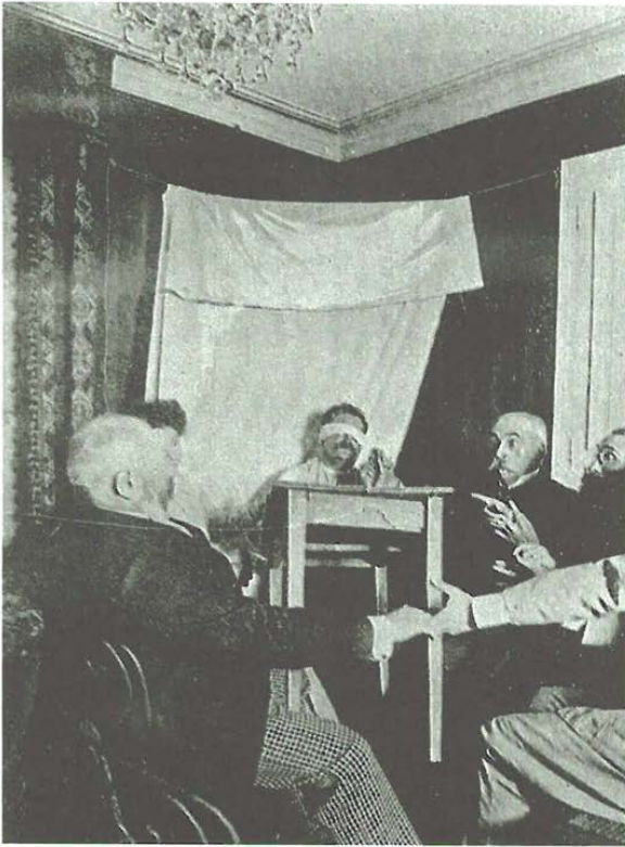
Abb. 1 Sou- lèvement d'une Table

viel Plüsch und Polstern, Gummibäumen, schweren Samtvorhängen und Historienbildern an der Wand ist dieses Wohnzimmer die Ikone des Historismus und zugleich scheinbar das genaue Gegenteil zum nüchternen Labor des Naturwissenschaftlers. Der Versuchsaufbau der Séance im Wohn- oder Spielzimmer des Wissenschaftlers vermengt den Positivismus des Labors mit dem Historismus des Salons. Damit werden von der leisen Verrückung des Vertrauten, vom Unheimlichen im wahren Wortsinne, sowohl das Weltbild als auch die Lebenswelt des Forschers erfaßt. Weder das geschlossene mechanistische Weltbild noch die behäbige großbürgerliche Prachtentfaltung sind vor der Willkür der Geister