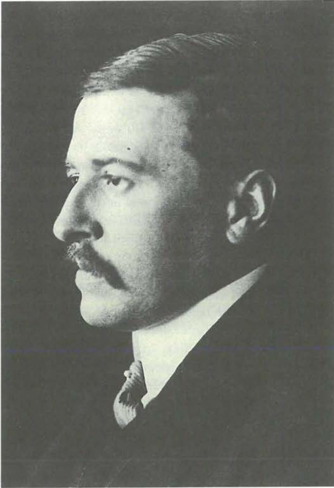
Hugo von Hofmannsthal