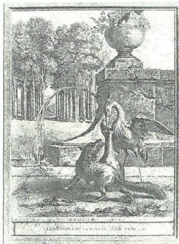
Illustrationen aus: La Fontaine. Fables choisies . Paris: Desaint et Saillant, 1755–1759

Liest man die Fabel La Fontaines in der von Madame de Staël gewiesenen Interpretationshypothese, in den beiden Tieren die Allegorisierung zweier Nationalcharaktere zu sehen, so offeriert der Text allerdings eine überraschende Fülle von Verweisen, von sinnbildhaften Verkürzungen einer weitreichenden Beziehungsgeschichte. Nicht der