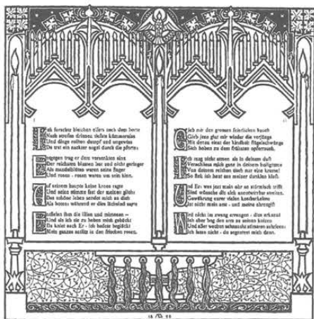
Abb. 5: Textseite aus dem »Teppich des Lebens« (1899)

sah in ihm einen Boten in die Zukunft, die »freudige[n] aufschwung [...] von malerei und verzierung« und ein »neues schönheitsverlangen« zu geben versprach. 35