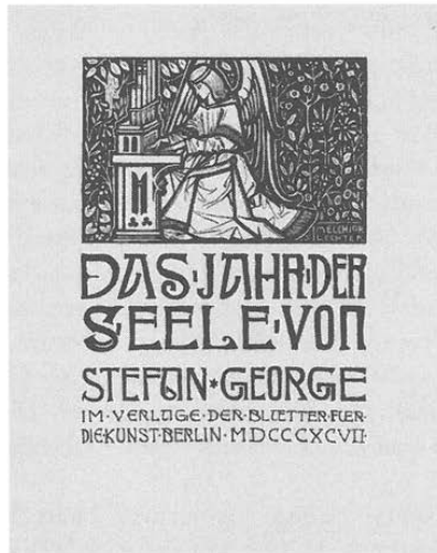
Abb. 3: Das von Melchior Lechter gestaltete Titelblatt zum »Jahr der Seele«-Band von 1897

gekehrt zu fragen, ob es tatsächlich in Georges Sinn habe liegen können, daß Lechters Bilder seine Lyrik in einen kulturarchäologisch