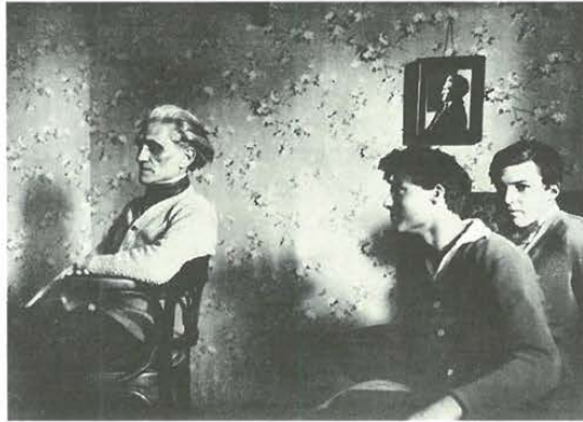
Abb. 2: Stefan George mit Claus und Berthold von Stauffenberg im Pfortnerhaus einer Grunewalder Villa (Herbst 1924)

begeben kann, wird man durch die gegenläufigen Anweisungen, die seine Form enthält, abgelenkt: Entweder sieht man die Präsenz des Fotografierten im Bild durch die Doppelung des Motivs beglaubigt, oder man zieht umgekehrt den vorgeblichen »Realismus« beider Fotos in Zweifel, einen Realismus, zu dessen Legitimation nichts anderes herangezogen werden kann als eine Serie weiterer Fotos.