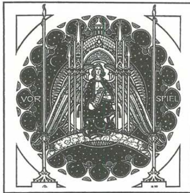
Abb. 4: Melchior Lechters Illustration zum »Vorspiel« im »Teppich des Lebens« (1899)

Entzweiung von Stimme, Schrift und Bild zusprach. Dabei orientierte sich Lechter an den Schriften und Werken des Engländers William