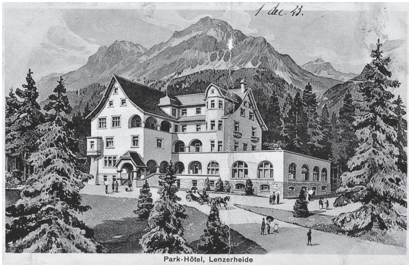
Das Park-Hotel in Lenzerheide, um 1923