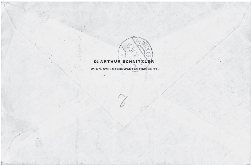
Ein ungedruckter Brief Arthur Schnitzlers 219