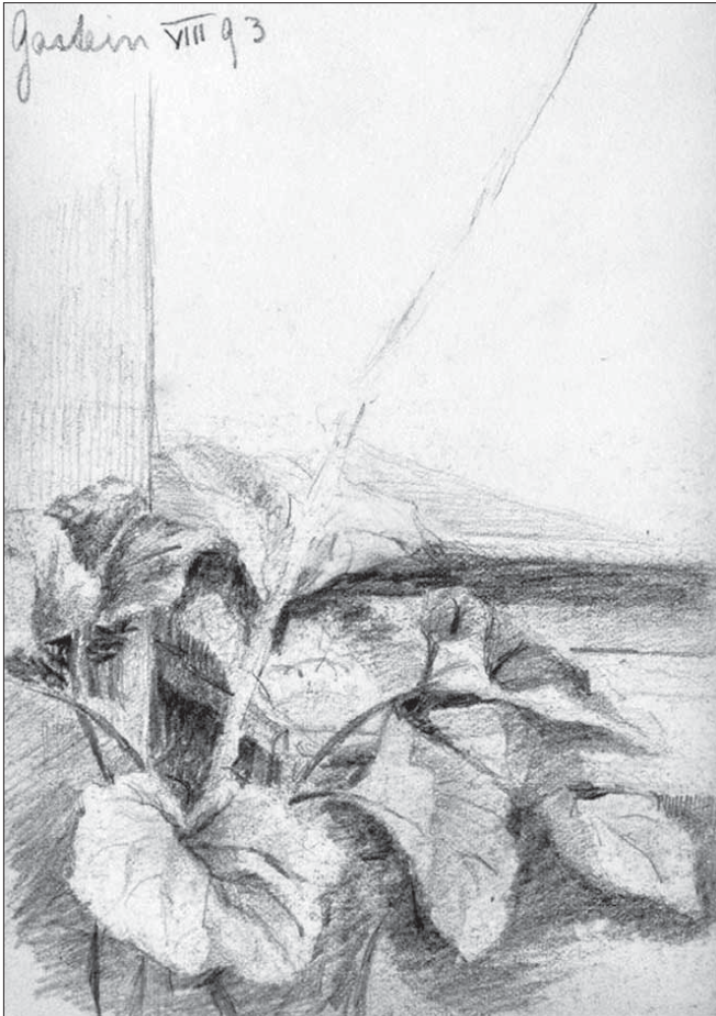
Abb. 10: Aus Elsa Cantacuzènes Skizzenbuch, 1888 (BSB)