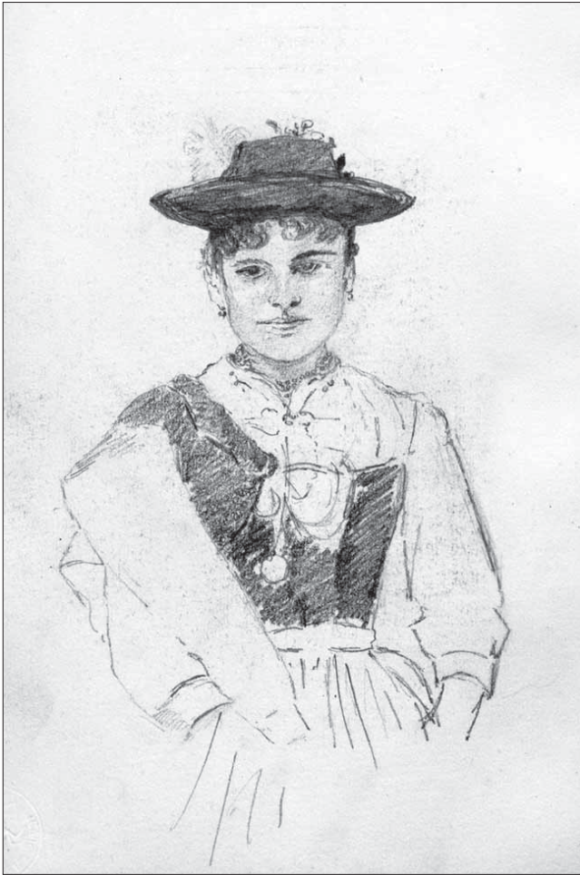
Abb. 4: Aus Elsa Canacuzènes Skizzenbuch, 1888