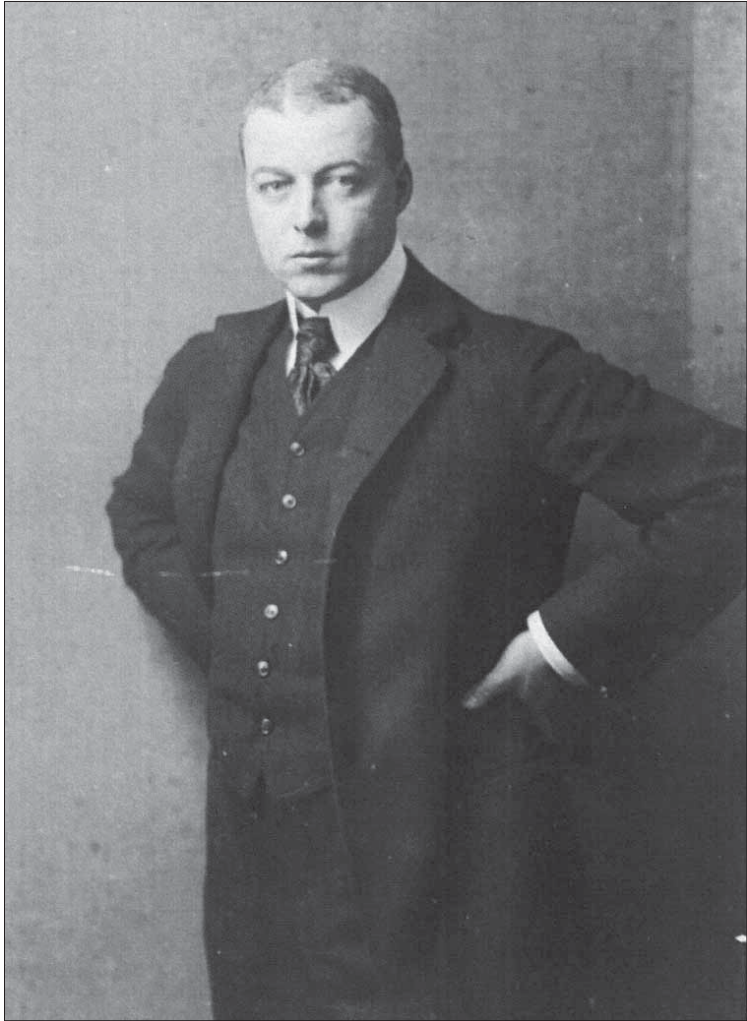
Abb. 2: Eberhard von Bodenhausen, etwa 1912. Fotografie aus dem Atelier Julius Benade, Kassel (LHASA, MD, H 52, Nr. 347, Bild 115)