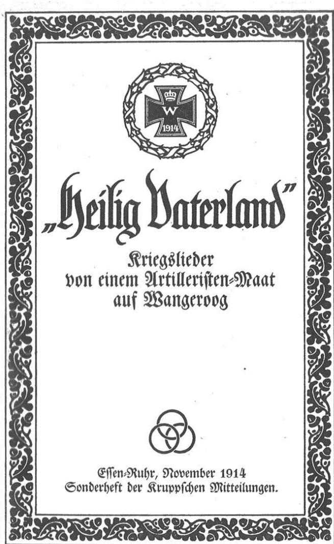
Abb. 4: »[...] auf einem höchsten Form- und Inhaltsniveau«. Rudolf Alexander Schröders »Kriegslieder«. Sonderdruck der »Kruppschen Mitteilungen« aus dem November 1914 (Historisches Archiv Krupp, Essen)