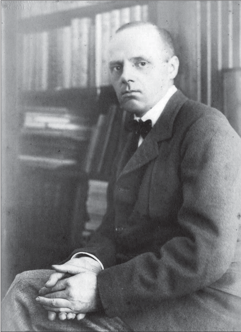
Abb. 8: Rudolf Alexander Schröder, um 1917.