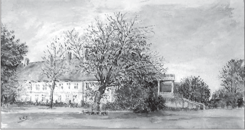
Abb. 9: Aquarell des Gutshauses Degenershausen von Rudolf Alexander Schröder, etwa 1928 (Privatbesitz)

Bevor das Jahr 1918 zu Ende geht, werden die in Berlin bestellten Grabplatten mit Verspätung geliefert, 564 und Dora von Bodenhausen denkt darüber nach, einen anderen Architekten zu beauftragen. 565 Ihr Ton wird dabei merklich gereizter: