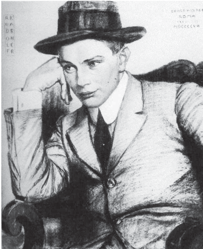
Abb. 2: Ernst Noether: Rudolf Kassner. Kreidezeichnung. 1907

Kassner zieht sich am 30. Juni von Rom nach Vallombrosa bei Florenz zurück. Bis »Mitte September« logiert er in der »schattigen Waldeinsamkeit« des in 957 m Höhe gelegenen »Albergo della Foresta«, der früheren Foresteria des 1015 gegründeten und 1866 aufgehobenen Klosters, 66 und setzt die Arbeit an seiner »Melancholia« fort.