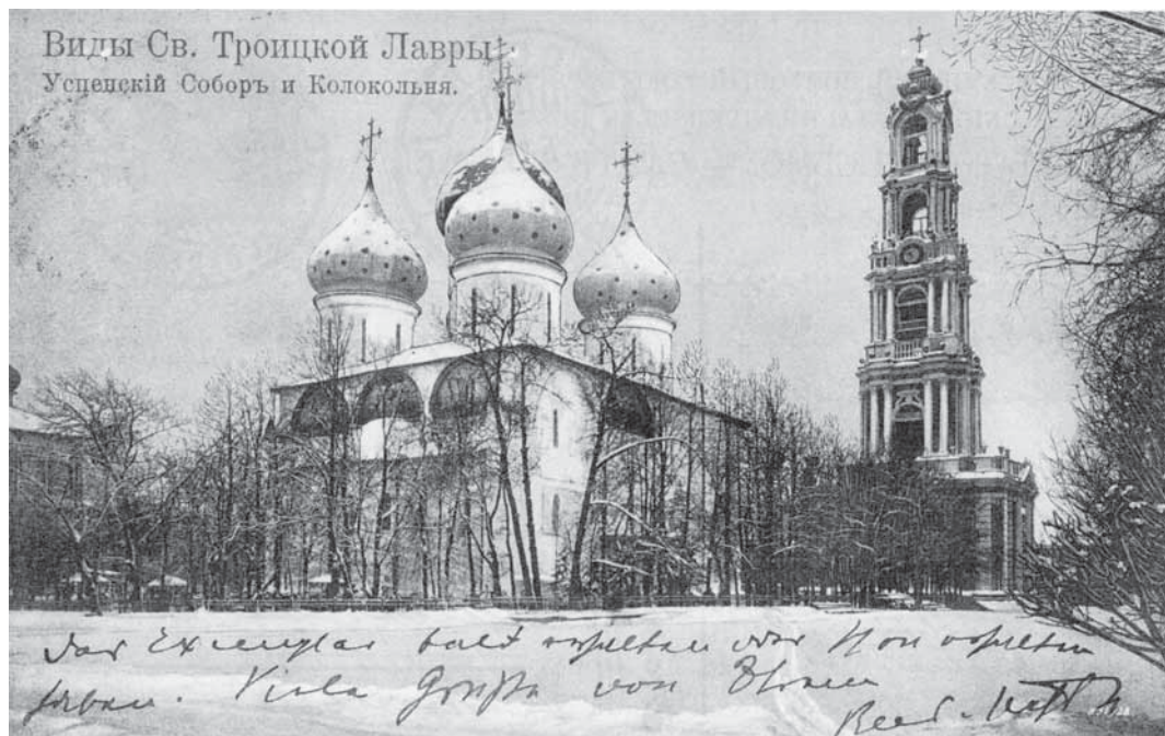
Abb. 5: Dreifaltigkeitskloster in Sergijew Possad. Ansichtskarte, 11. Juni 1911 (AST)