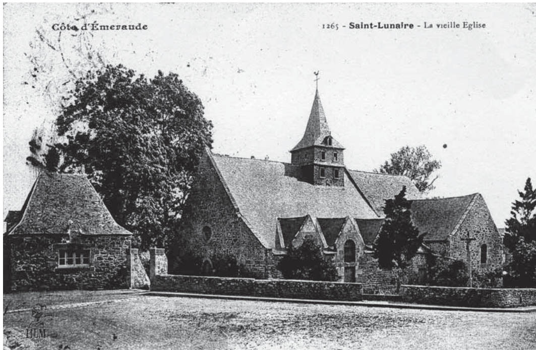
Abb. 4: Saint-Lunaire. Ansichtskarte, dritte Julidekade 1910