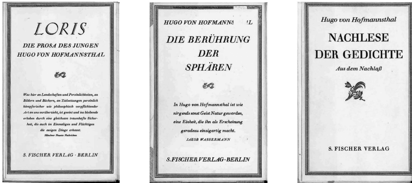
Abb. 2: Bandumschläge

Festspiele in Salzburg. Wien: Bermann-Fischer 1938 (zuvor in: Die Berührung der Sphären).