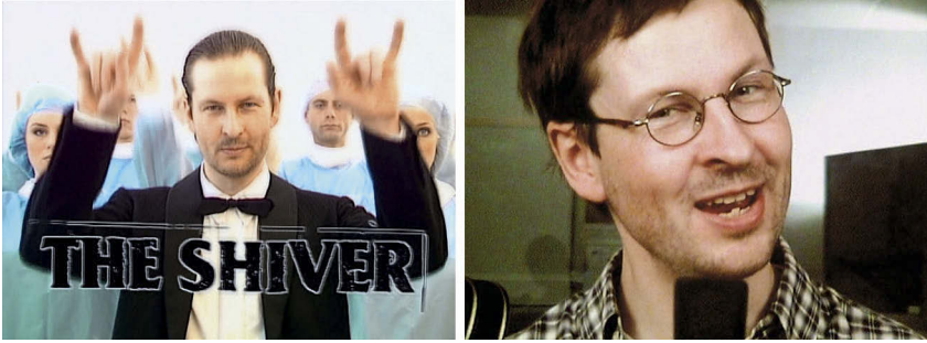
Abb. 2.1: Lars von Trier in »The Shiver« (1994; links) und »You're a Lady« (1998; rechts).

Das Video zeigt die Musik-Performance dann im freien Fall von 4,8 Kilometern. In »Bet It On You« (1990) ist zu sehen, wie Personen absurde Guinness-Rekorde zu brechen versuchen: Ein Mann scheitert dabei, 30 Schokoküsse zu essen; ein anderer stellt einen neuen Rekord auf, indem er 140 Kilogramm mit seinem Bart anhebt. Für »Change« (1992) haben alle Darsteller*innen rückwärts performt, während das Lied rückwärts abgespielt wurde. Anschließend wurde das Video rückwärts kopiert, sodass die Aktionen und das Lied wieder vorwärts laufen, die Bewegungen jedoch demnach unnatürlich wirken.