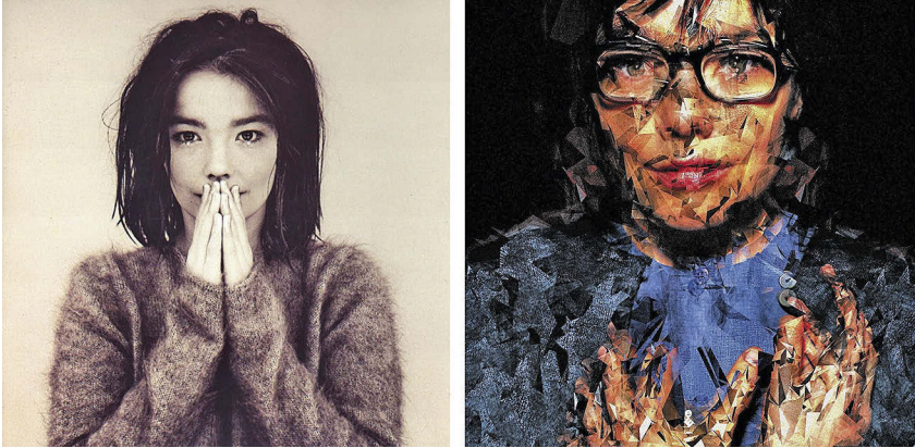
Abb. 9.1: Cover von Debut (One Little Indian und Elektra Records, 1993; links) und Selmasongs (One Little Indian, 2000; rechts).

zum Song (Regie: Inez van Lamsweerde und Vinoodh Matadin, 2001) verstärkt den Eindruck von Authentizität und Intimität, indem es Björk scheinbar nackt und ungeschminkt in extremen Nahaufnahmen zeigt. Dieses authentische Image von Björk steht in engem Zusammenhang mit ihrer Performance im Film und der Figur der Selma.