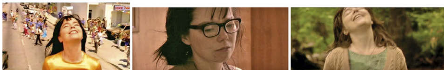
Abb. 9.3: Die Konstruktion von Björks Performance in Dancer in the Dark (links: »It's Oh So Quiet«, 3:38; in der Mitte: Dancer in the Dark , 0:59:59; rechts: ebd., 1:15:11).