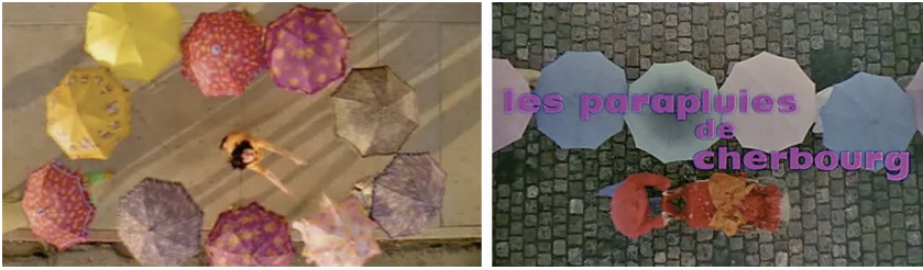
Abb. 9.2: Das Musikvideo zu »It's Oh So Quiet« (2:45) zitiert Demys Musicalfilm Les Parapluies de Cherbourg (0:01:04).

dynamischen Kamerabewegungen (»Whip Pans«) in den Refrains erzeugen einen Kontrast zu den Zeitlupenaufnahmen in den Strophen (Rosiny 2013: 190). Hinzu kommt eine leichte Farbaufhellung in den Refrains, sodass die Farben während der Strophen etwas kälter sind.