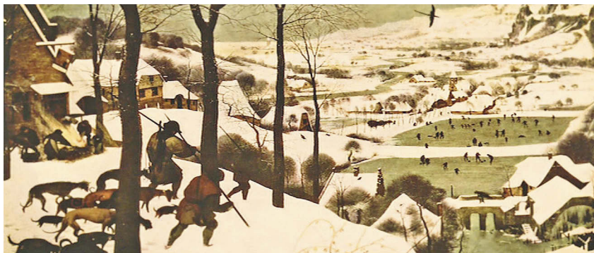
Abb. 7.5a: Die Jäger im Schnee von Pieter Bruegel dem Älteren in der Eingangssequenz (0:01:29) und in einer späteren Szene in der Bibliothek (0:43:15).

schrieben (Trier 2009: 2). Zudem werden dort die ersten Filmbilder als »Erinnerungsbilder von Justines Melancholie« bezeichnet (ebd.: 2). 124 Eine genaue Beschreibung dieser Wiederkehr bleibt bei Sonntag und Larkin allerdings aus. Im Folgenden zeige ich, dass auf dieser Makroebene eine Verbindung zwischen Musik und Bild vorherrscht, indem die einzelnen musikalischen Cues nicht nur auf auditiver Ebene auf bestimmte Abschnitte der Eingangssequenz sowie des Films verweisen, sondern die Cues ebenso auf visueller und narrativer Ebene Rückbezüge herstellen.