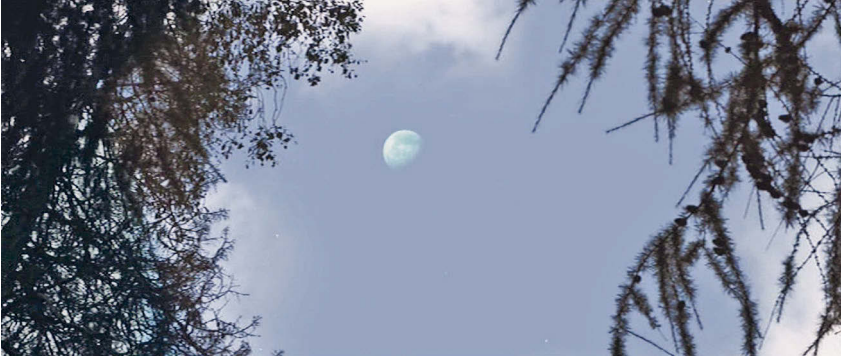
Abb. 7.8b: Forts.