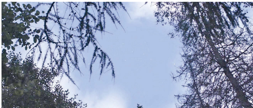
Abb. 7.8a: Melancholia s Unsichtbarkeit (1:05:39; Cue 7) und Sichtbarkeit (1:19:50; Cue 8).

diesem Zeitpunkt aber noch sehr weit von der Erde entfernt steht«. Allerdings ist weder in Cue 2, 5, 6 noch 7 der Planet sichtbar. Das Publikum sieht lediglich, dass Justine etwas am Himmel zu sehen scheint. Die motivische Koordination in Verbindung mit der Eingangssequenz führt jedoch dazu, dass es trotzdem erahnt, was Justines Aufmerksamkeit erregt. Durch das Tristan -Vorspiel hört es Justines Herbeisehnen des Planeten. Justines Sehnsucht trifft sich also mit jener des Tristan , für dessen Musik die Sehnsucht nicht nur werkimmanent, sondern auch werkbegleitend, etwa in der Leitmotivexegese, einen zentralen Topos darstellt.