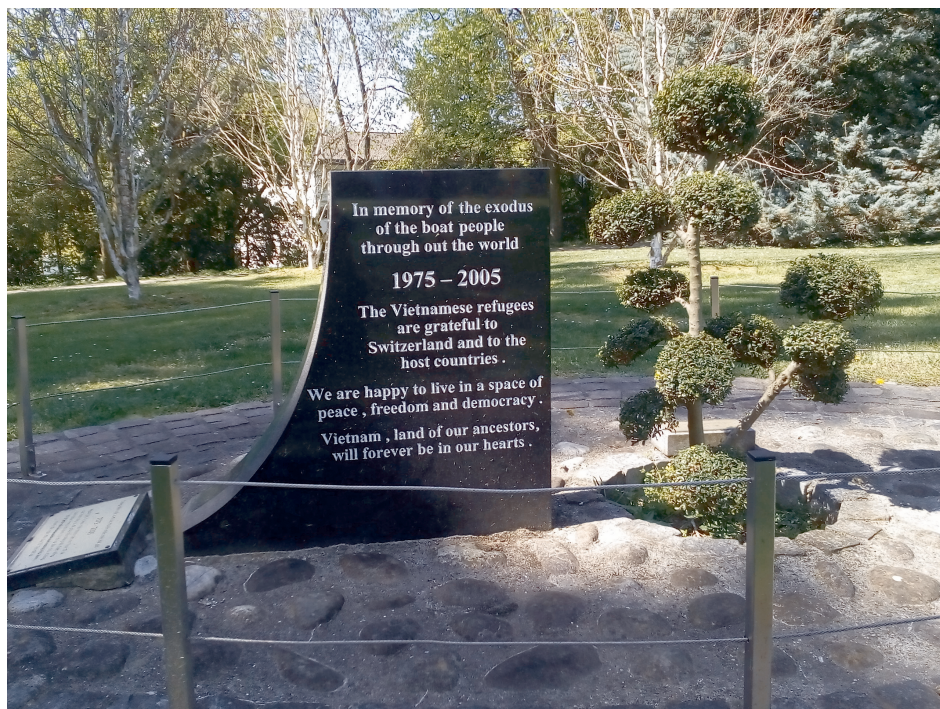
Abbildung 4: Gedenkstein im Park des Schlosses Grand-Saconnex in Genf

Markant ist ebenfalls, dass vietnamesische sowie schweizerisch-vietnamesische Vereine vorwiegend in der Romandie entstanden. Neben dem bereits erwähnten Verein «L`association des Vietnamiens libres de Lausanne» [Vereinigung vietnamesischer Studenten in Lausanne] entstanden in den folgenden Jahren weitere Zusammenschlüsse, die der Kulturpflege und Rückbesinnung dienen – vorwiegend in Städten wie Genf, Lausanne und Neuenburg. 20