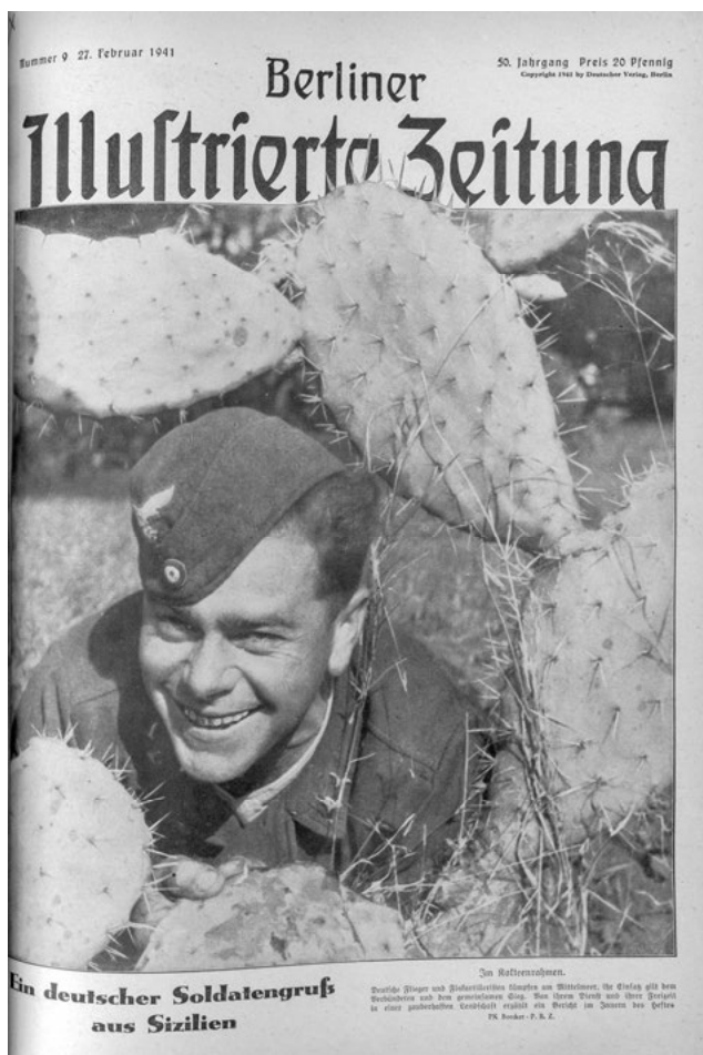
Abb. 1: „Ein deutscher Soldatengruß aus Sizilien“, in: Berliner Illustrierte Zeitung 50.9, 27. Februar 1941, S. 225.

diesem Beitrag untersuchten dokumentarischen Fotografien von Frontsoldaten dieser Zeit aber scheinen gegen all dies fast schon alltäglich. Sie erinnern, wie etwa die Fotografie eines zwischen großen Kakteen hervorschauenden, fröhlich grinenden Soldaten auf der Titelseite der BIZ vom 27. Februar 1941, eher an den sympathischen Nachbarn, Bruder, Freund oder Geliebten, als dass sie Merkmale einer wie auch immer gearteten Außerordentlichkeit anbieten würden (Abb. 1).