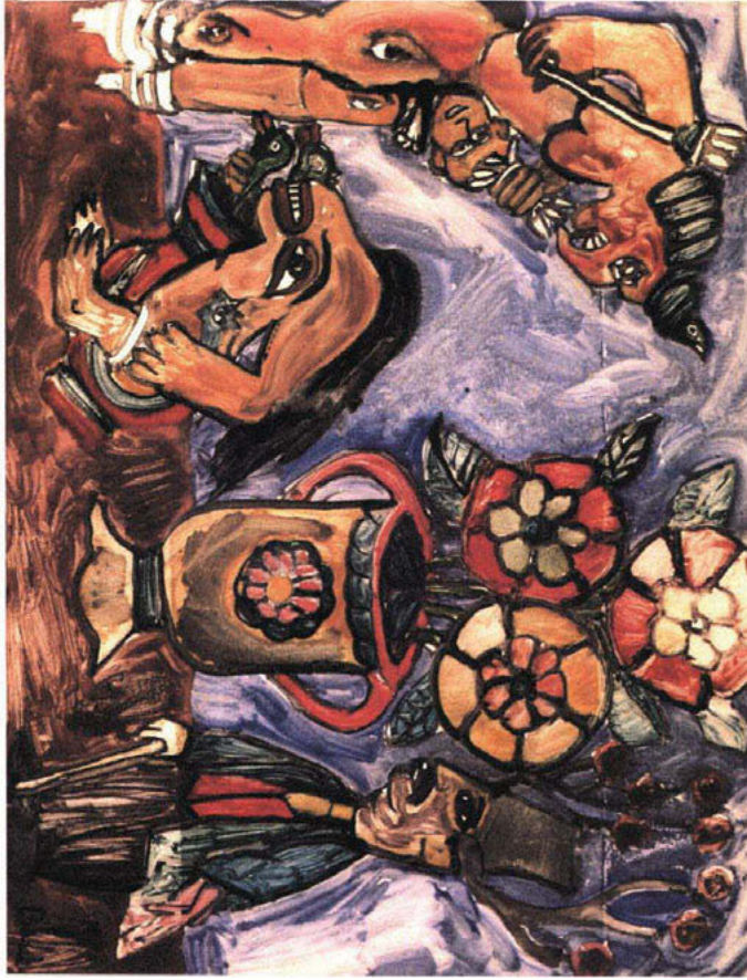
111. 3: Rüya (Rêve) du peintre Cihat Burak (1963).