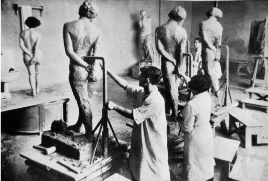
Abb. 6: Modellieren nach Aktmodell in der Bildhauerabteilung, 1936 ( Güzel San'atlar , Istanbul 1936, o. S.)

Im Garten der Akademie wurde nach Bellings Vorschlägen ein Ateliergebäude eingerichtet, in dem Fenster und Lichteinfall auf die Bedürfnisse der bildhauernden Studenten ausgerichtet waren. In diesem Gebäude waren fünf Ateliers untergebracht: ein Porträt-Atelier, ein Relief-Atelier, ein „Atelier, in dem nun so figürlich gearbeitet wurde, daß man um die Plastik herum gehen konnte“ 37 , ein Ziselier-Atelier, eine Steinbildhauerei. Die Ausbildung war in drei Studienabschnitte unterteilt: Zunächst sollten sich die Studenten mit anatomischen Studien befassen und antike Skulpturen kopieren. Das zweite Jahr war der Erarbeitung von Reliefs gewidmet; erst im dritten Studienabschnitt sollten sich die Schüler der Herstellung von Plastiken widmen. In den „cours de soir“ wurde lebensgroß nach Aktmodellen gearbeitet (Abb. 6) – ein Novum in der Türkei. Denn erst unter Atatürk wurde der Akt als Studienobjekt zugelassen und damit zum wichtigen Thema in der Bildhauerausbildung. 38 Im vierten Jahr konnten die Studenten eine eigenständige Komposition erstellen.