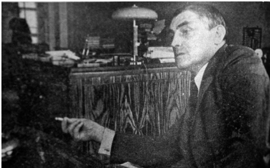
Abb. 5: Rudolf Belling, 1937 (Yedigün, H. 212, Bd. 9, März 1937, S. 8)

tungsvolle Aufgabe gestellt. Er sollte in einem Land ohne weit zurückreichende bildhauerische Tradition und an einer technisch und personell unterversorgten Institution eine eigene Kultur der Bildhauerei begründen. Denn während in der Zeit zwischen 1927 und 1936 durch das Wirken Ernst Eglis an der Architekturabteilung große Reformen durchgeführt worden waren, die dem Fach zu Reputation verhelfen, gehörten Bildhauerei und Malerei zu den an der Akademie vernachlässigten Fächern. Erst die Berufung ausländischer Spezialisten sollte zur Erneuerung dieser Disziplinen beziehungsweise deren weiterer Professionalisierung führen.