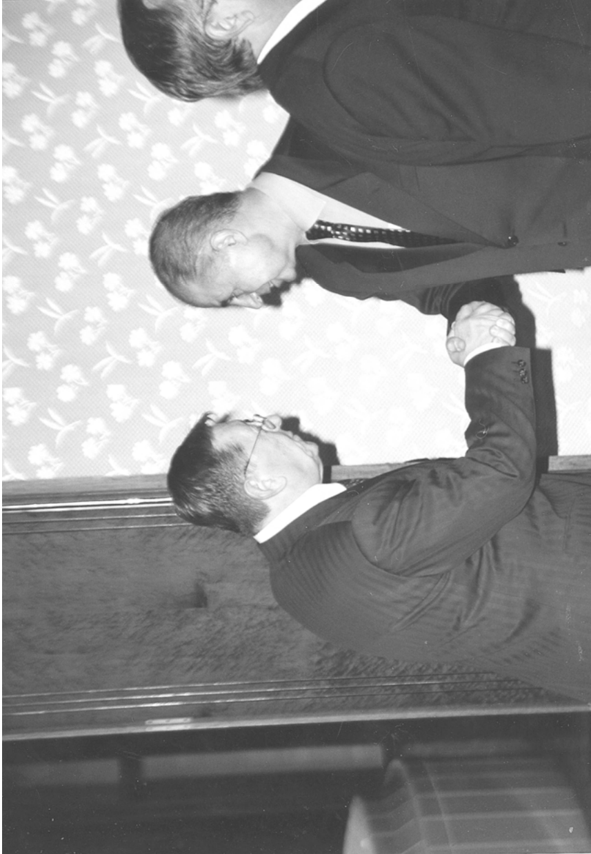
Zu Besuch beim 10. Staatspräsidenten, Necdet Sezer, 2001