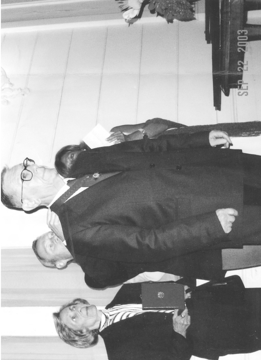
Bei der Verleihung des Ordens „Alfonso X. Del Sabio“ durch den spanischen Botschafter in der Türkei, Manuel de la Camara, 2003