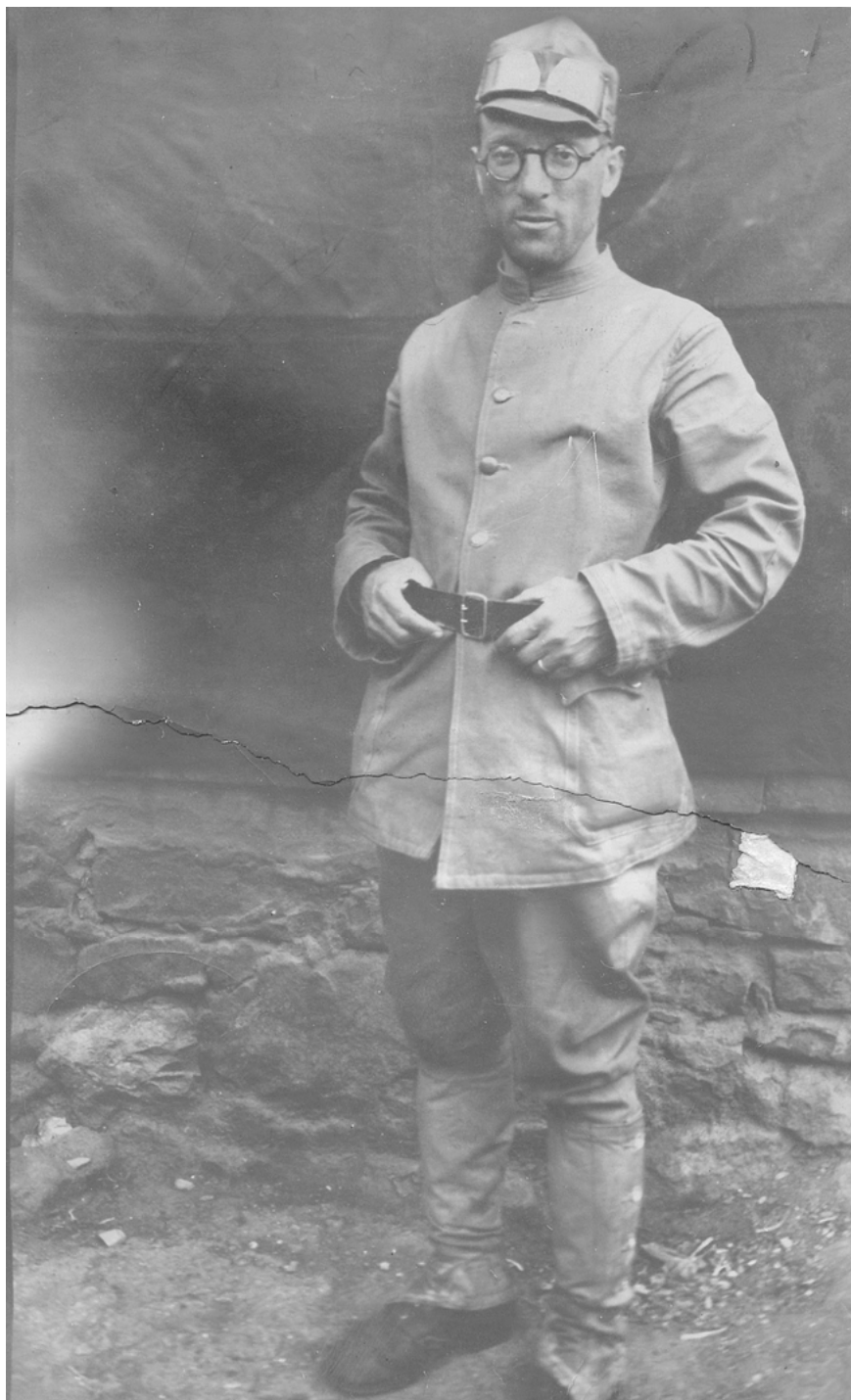
Mein Vater während seines zweiten Militärdienstes, 1942