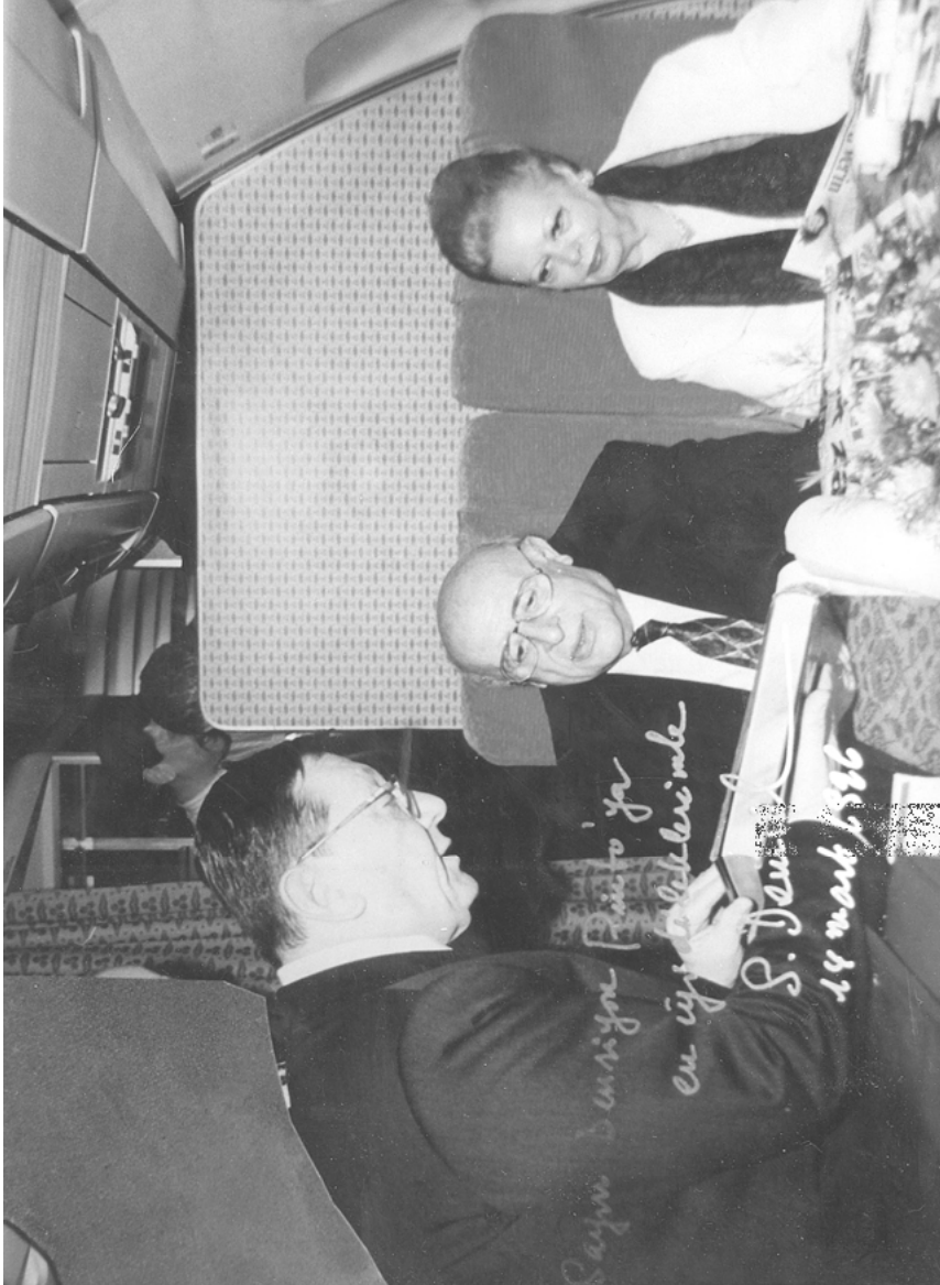
Auf einer Israelreise mit dem 9. Staatspräsidenten der Türkei, Süleyman Demirel, und seiner Frau Nazmiye Demirel, 1999