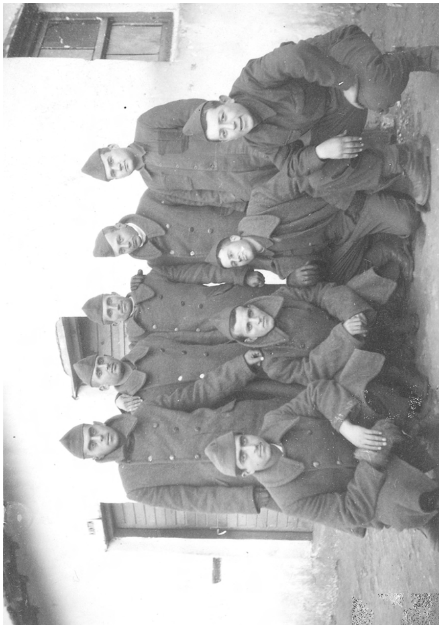
Am Entlassungstag einiger Kameraden während meines Wehrdienstes, 1957