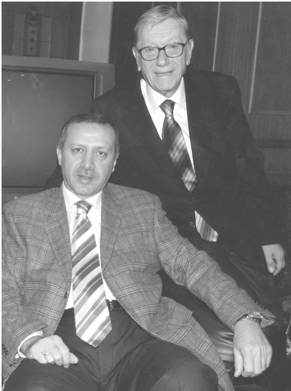
Zu Gast bei Ministerpräsident Recep Tayyip Erdoğan in dessen Wohnhaus in Istanbul, 2004