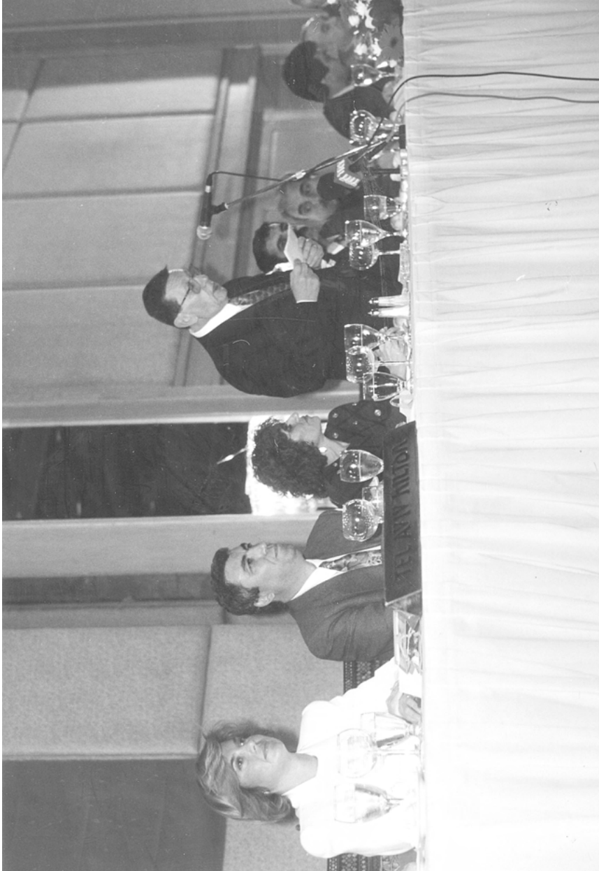
Mit der Ministerpräsidentin Tansu Çiller in Tel Aviv, 1994