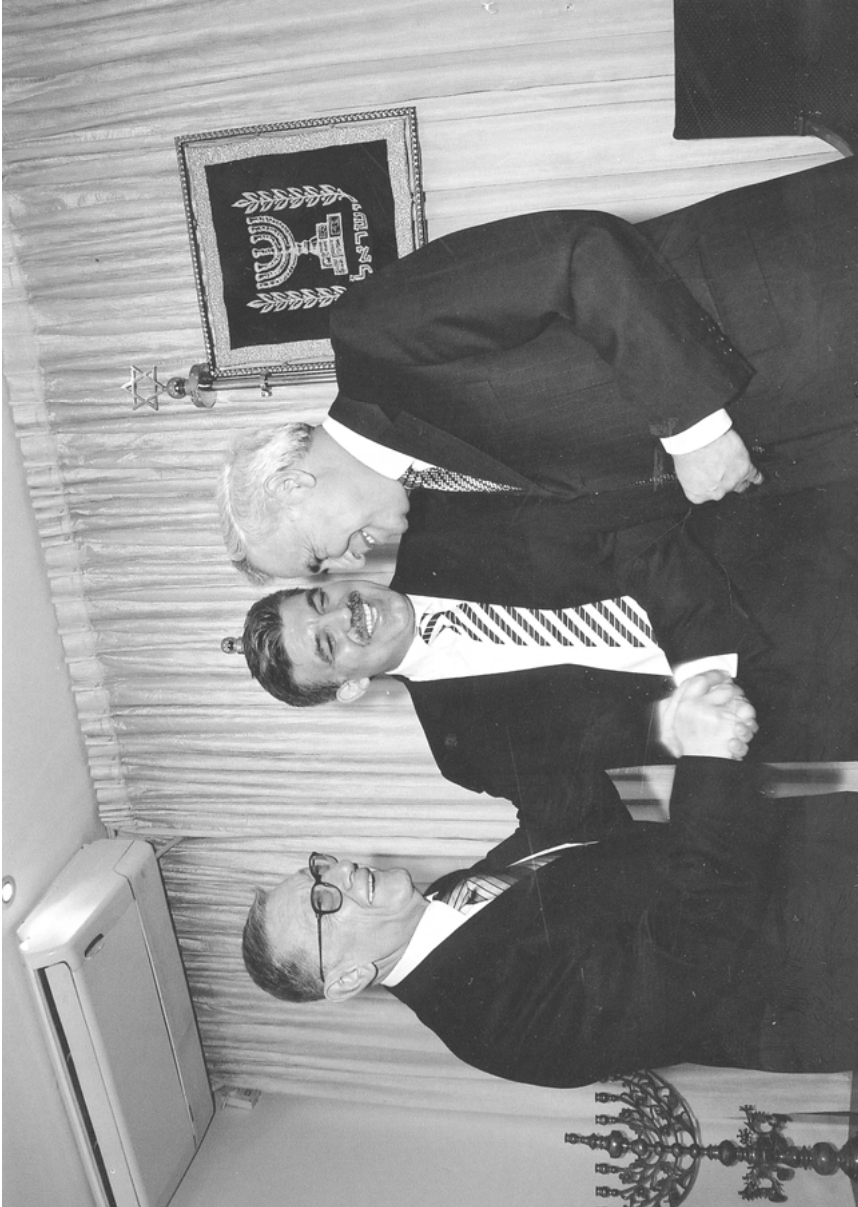
Beim Empfang des israelischen Präsidenten Mosche Katsaw für den damaligen türkischen Außenminister Abdullah Gül, 2005