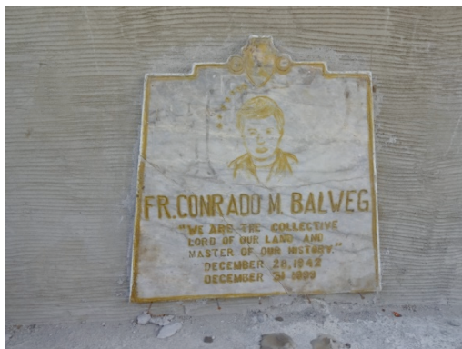
Abb. 9 Grabplatte von Conrado Balweg. „We are the collective Lord of our Land and master of our history“

Balweg starb auf der Stelle am 31. 12. 1999 (siehe Abb. 8 und 9). Die Gewalt hatte ihn eingeholt. 72