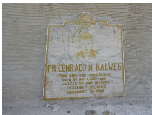
Abb. 9 Grabplatte von Conrado Balweg. „We are the collective Lord of our Land and master of our history“

Balweg starb auf der Stelle am 31. 12. 1999 (siehe Abb. 8 und 9). Die Gewalt hatte ihn eingeholt. 72