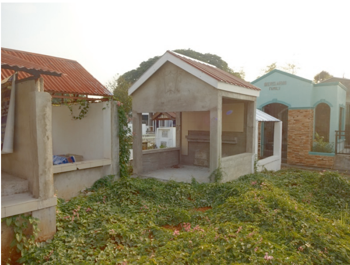
Abb. 8 Mausoleum von Azon und Conrado Balweg, Bangued/Abra. Schild und Speer im Giebel eingeritzt