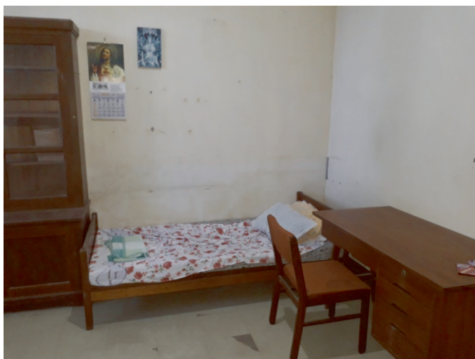
Abb. 3 Balwegs Zimmer im Regionalhaus der SVD, Bangued-Ubbog

Nach einigen Tagen aber tauchte Balweg unter. Freilich hatte er dies bereits vorbereitet: Die 14.800 Pesos für den Bau eines Internats in seiner Pfarrei Sallapadan und ca. 10.000 Pesos auf dem Gemeindekonto waren verschwunden. 57 Wahrscheinlich hat sie Balweg mit in die Berge genommen.