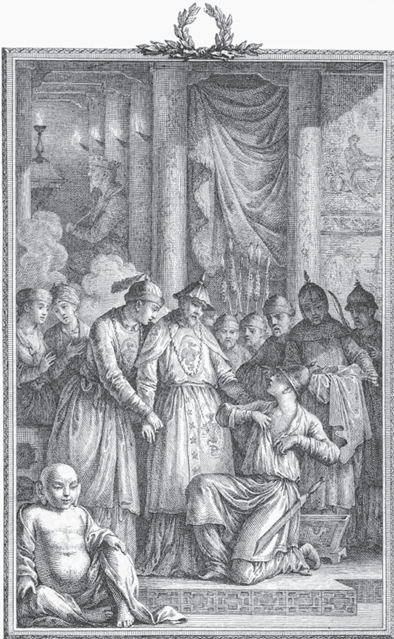
Abb. 2: Leango erkennt in Minteo seinen toterglaubten Sohn. Kupferstich zur Schlusszene [III 9] von Pietro Metastasio, L'eroe cinese (in: Opere, Bd. 7, Paris 1780), mit dem Zitat von Minteos Rede: „Parlano queste cicatrici abbastanza. Osserva. Il caro mio genitor tu sei.“