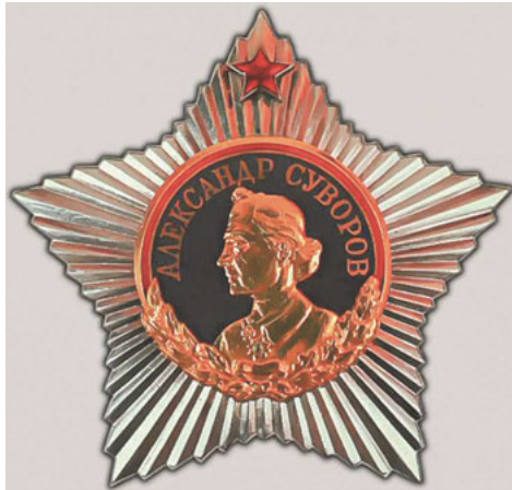
Abb. 1: Suvorov-Orden, 1942.