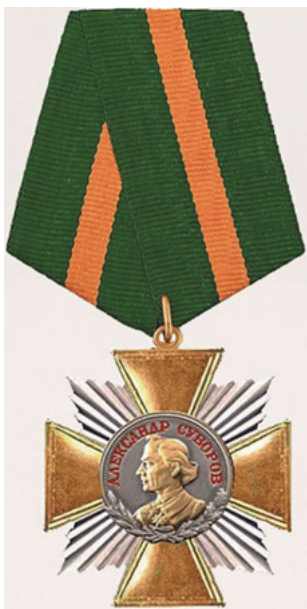
Abb. 9: Suvorov-Orden, 2010.

Niederlagen. Sobald es sich an ihn erinnerte, errang es große Siege.“ So lautet ein wiederkehrender Satz in neueren russischen Publikationen und Dokumentationen. 44