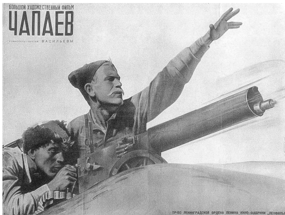
Abb. 6: Filmplakat „Čapaev“, 1935.

Minin und Požarskij, Peter der Große – und eben Suworov (Abb. 7). Auch hier sieht man ganz deutlich, wie das Kriegsplakat von 1942 den Film aufgreift, bis hin zur charakteristischen Haartolle und Säbelquaste. Bis heute ist der Film populär. Wer in Russland den Namen Suworov hört, denkt häufig zu allererst an diesen Film. Noch stärker ist die Bezugnahme auf den Film bei Aleksandr Nevskij: Hier bedient sich sogar der Orden des Films: Auf dem Orden ist nämlich gar nicht Aleksandr Nevskij abgebildet, sondern der Schauspieler Nikolaj Čerkassov (Abb. 8), der ihn 1938 im Film verkörperte, da es keine zeitgenössische Abbildung des Fürsten gibt und sich Ikonen und andere spätere idealisierende bildliche Darstellungen nicht für einen Militärorden eigneten. Zu jeder historischen Persönlichkeit, nach der im Zweiten Weltkrieg ein sowjetischer Militärorden benannt wurde, wurde zwischen 1940 und 1953 auch ein Spielfilm gedreht: „Aleksandr Nevskij“ (1938), „Suworov“ (1940), „Kutuzov“ (1943), „Bogdan Chmel’nickij“ (1941), „Admiral Nachimov“ (1946), „Admiral Ušakov“ (1953). 17