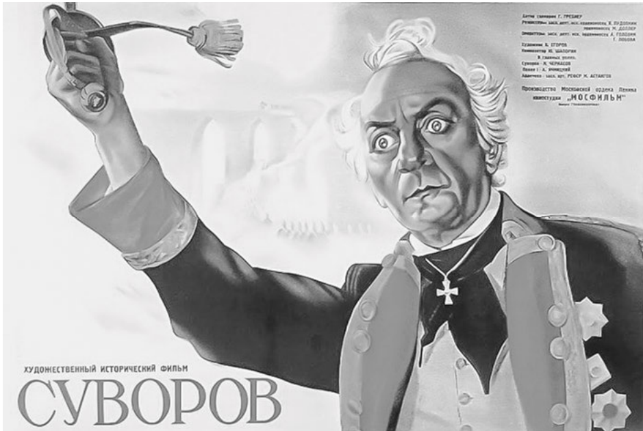
Abb. 7: Filmplakat „Suvorov“, 1941.