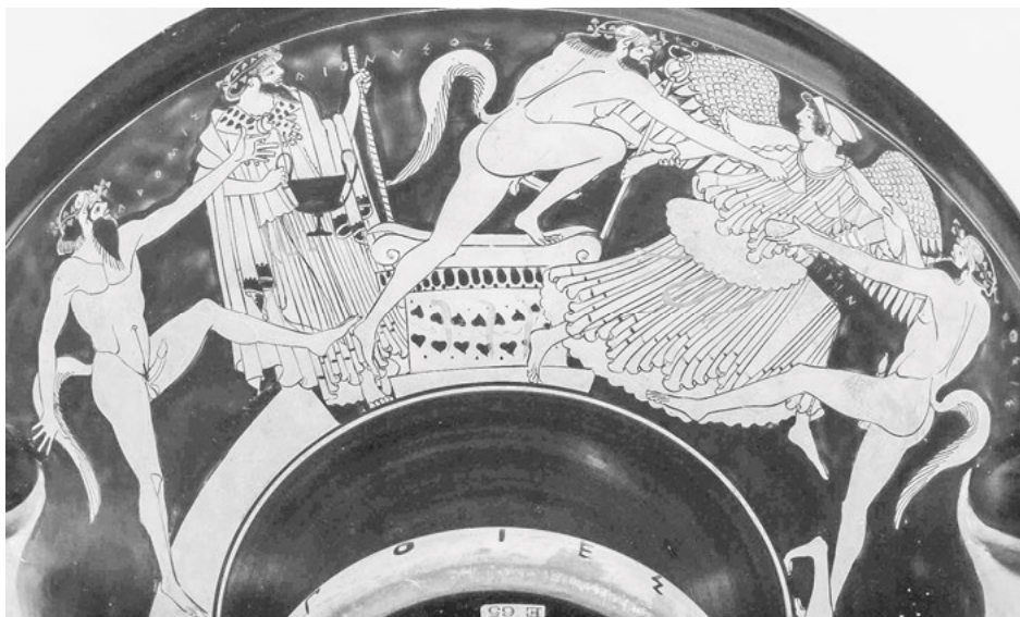
Abb. 3: Dionysos mit Kantharos unter Satyrn auf einer attisch-rotfigurigen Schale des Brygos: Ton, frühes 5. Jahrhundert v. Chr., London, British Museum, Acc. No. 1873.8-10.376 (E 65).

dort der Weinkonsum eine Rolle spielte. In Athen hingegen waren solche Tonkantharoi mit hohem Fuß weitaus seltener als in Böotien. 22