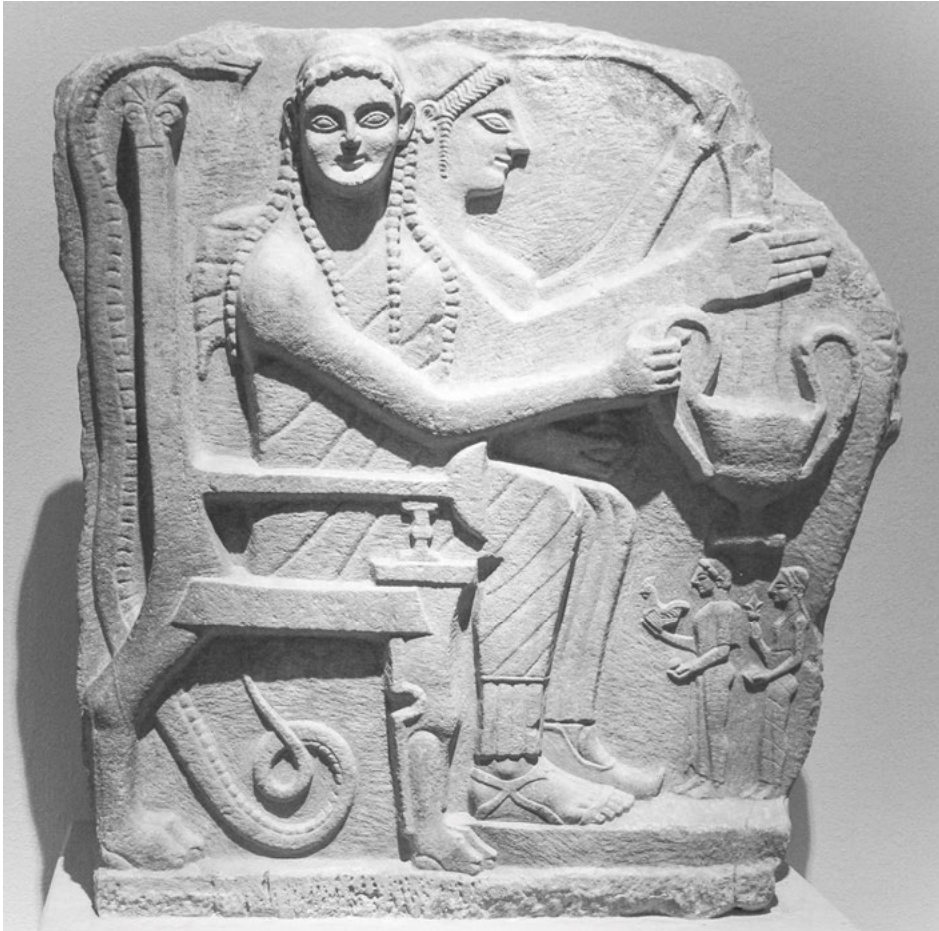
Abb. 4: Spartanisches Heroenrelief aus Chrysapha: Marmor, Höhe: 87 cm; um 560 v. Chr., Berlin, Antikensammlung SPK, Inv. Nr. Sk 731.

Darstellungen – wie es sich beim griechischen Gelage gehörte – liegender Heroen, die einen Kantharos halten oder bei sich haben, kennen wir im 5. Jahrhundert v. Chr. auch aus Böotien (Abb. 5 und 6). 31 Dass dort bisweilen eine Schlange