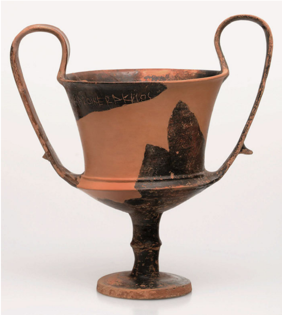
Abb. 1: Attischer Kantharos: Ton, aus Fragmenten zusammengesetzt, Höhe: 25,7 cm, spätes 5. Jahrhundert v. Chr., Hamburg, Museum für Kunst und Gewerbe, Inv. Nr. 1983.282.