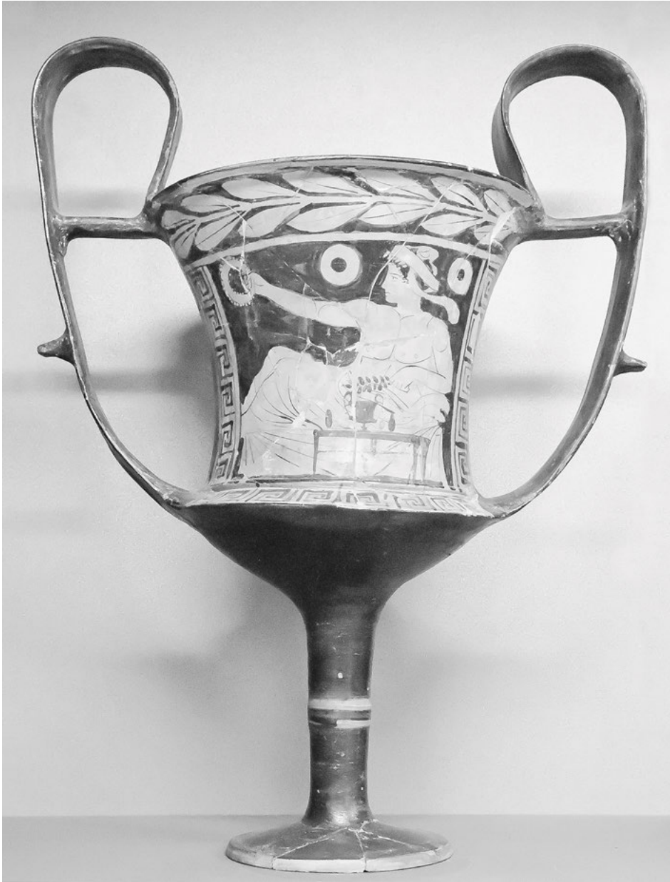
Abb. 6: Heros mit Kantharos beim Gelage, böotisch-rotfiguriger Kantharos: Ton, Höhe: 41,6 cm, um 450–430 v. Chr., Paris, Musée du Louvre, Inv. Nr. CA 1139.