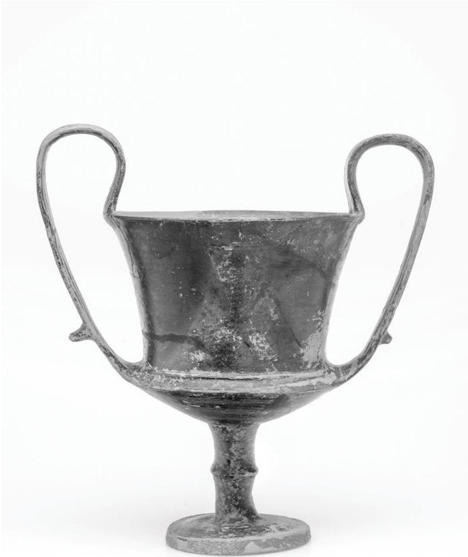
Abb. 2: Attischer Kantharos (wie Abb 1).