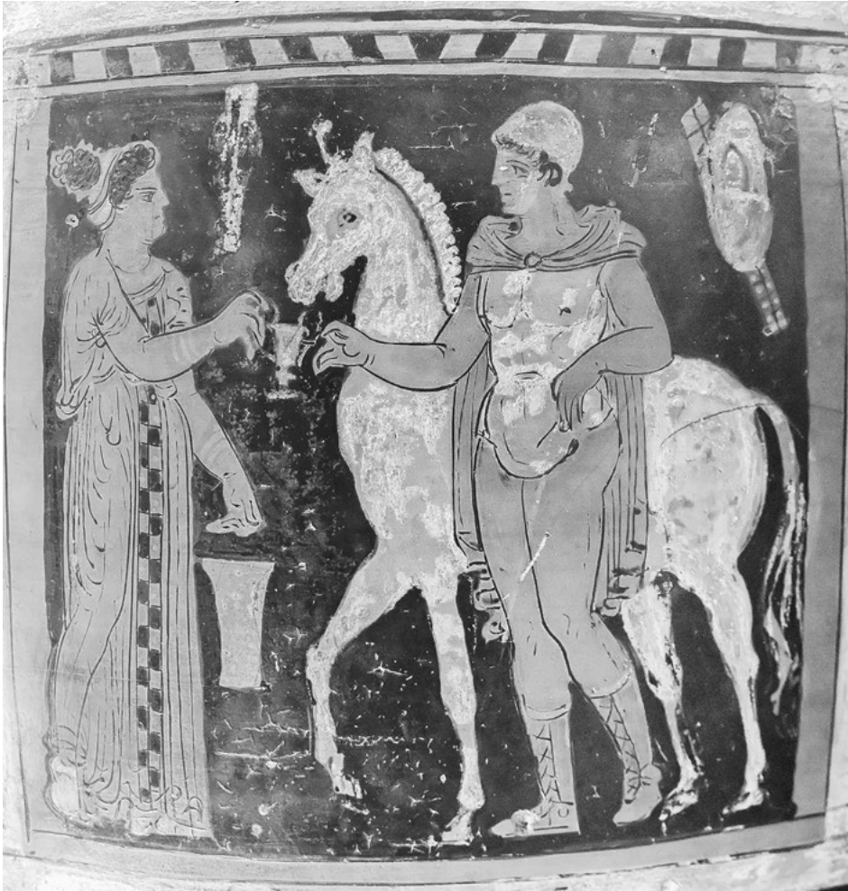
Abb. 7: Verstorbener Krieger mit Pferd erhält von einer Frau einen Kantharos auf einem apulisch-rothfigurigen Grabkrater: Ton, spätes 4. Jahrhundert v. Chr., Paris, Musée du Louvre, Inv. Nr. K 68.

man ihn dort als Attribut von Kriegern, die an ihren Waffen erkennbar sind und die bisweilen auch eine Schlange als heroische Figuren kennzeichnet – um Weinkonsum geht es auch hier nicht. 34 Die Toten werden vielmehr als kampferprobt und im Krieg leistungsfähig dargestellt. Weshalb dann aber mit dem Kantharos? Dieselbe Frage stellt sich, wenn man darauf zurückblickt, dass Kantharoi in Böttchen nicht etwa nur dem Dionysos, sondern vielen Heroen und Göttern geweiht