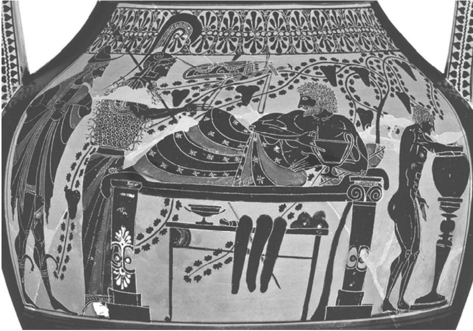
Abb. 8: Herakles mit Kantharos beim Gelage in Anwesenheit von Hermes und Athena, schwarzfiguriges Bild auf einer bilinguen attischen Bauchamphora: Ton, München, Antikensammlung, Inv. Nr. 2301 (J 388).

Weihreliefs an Herakles hin, die ihn auf einem Felsen liegend mit dem Kantharos und dem Füllhorn als Zeichen von Fülle und Wohlstand zeigen. 44