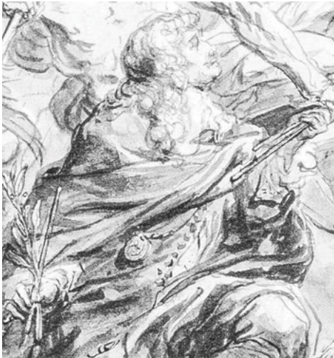
Abb. 10: Apotheose Joachim von Sandrarts, Detail: Zeichnung von Michael Willmann in Braun, Grau und Schwarz, Feder und Pinsel, laviert, Weißhöhung, auf gelblichem Papier, 1682, Wien, Albertina, Inv. Nr. 3567/1.

ter dem Schutz Minervas, Apolls und der Musen in Worten ausgemalt und sogar die einzelnen Mitglieder mit ihren literarischen und künstlerischen Leistungen vorgestellt werden.