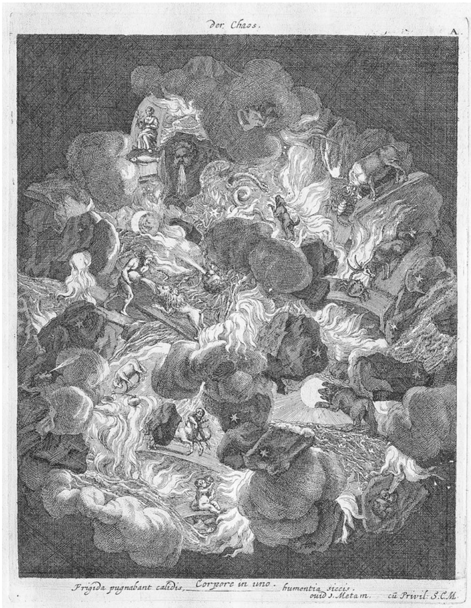
Abb. 11: Das Chaos: Kupferstich von Joachim von Sandrart, Tafel A. in der „Iconologia Deorum“, Nürnberg 1680.