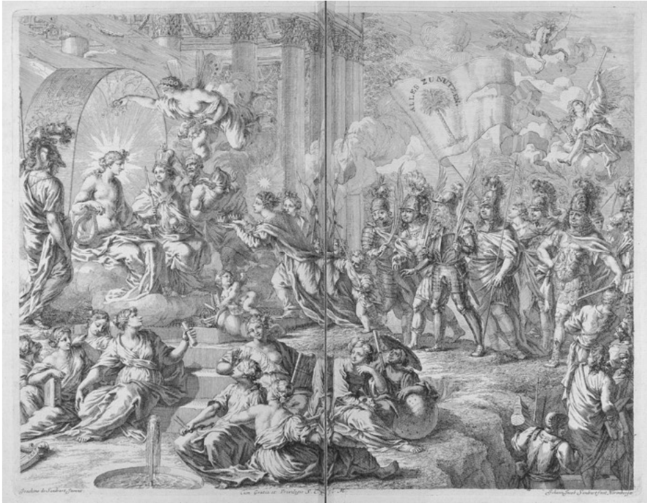
Abb. 7: Apoll empfängt die Mitglieder der Fruchtbringenden Gesellschaft auf dem Parnass: Titelkupferstich der „Iconologia Deorum“ von Joachim von Sandrart, Nürnberg 1680.

Andreas Herz zuletzt betonte, „keineswegs wie die Hof- und Ritterorden im Dienst der herrschaftlichen Repräsentation und deren künstlerischer Performanz auf, sondern verfolgte gemeinsame, tendenziell überständische und überkonfessionelle Normen, Leitbilder und Kulturansprüche.“ 13 Zu den Pflichten der Gesellschafter (wie auch der Applikanten) gehörte entsprechend ein ‚fruchtbringender‘, tugendsamer und friedlicher Lebenswandel. Ein jeder sollte: