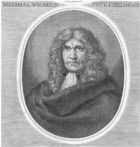
Abb. 13: Michael Willmann, Porträt: Kupferstich von Leonhard Heckenauer, in: Joachim von Sandrart, Academia nobilissimae artis pictoriae , Nürnberg 1683, Tafel 9.

veröffentlichte erweiterte Ausgabe der Künstlerviten in lateinischer Sprache, die „ Academia nobilissimae artis pictoriae “.