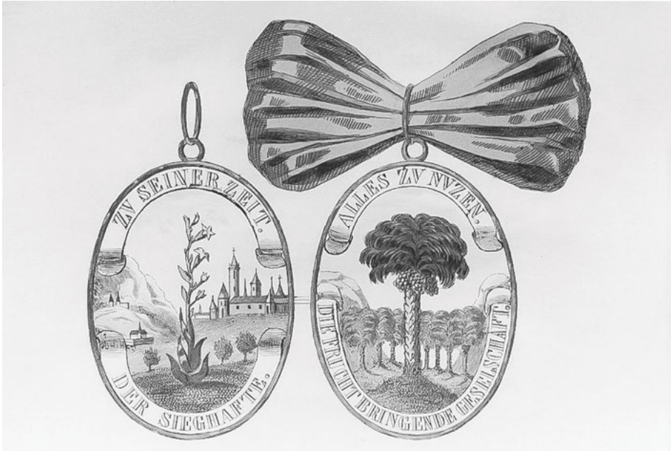
Abb. 9: Gesellschaftspfennig des Fürsten August von Anhalt-Plötzkau (1575–1653).