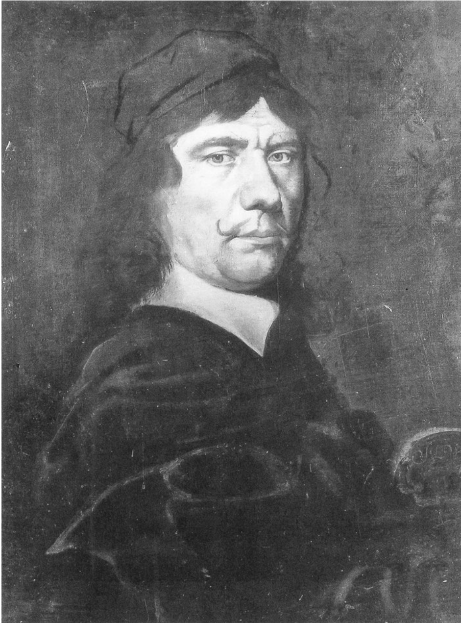
Abb. 6: Michael Willmann, Selbstporträt: Öl auf Leinwand, 64 × 51 cm, 1682, Warschau, Nationalmuseum.