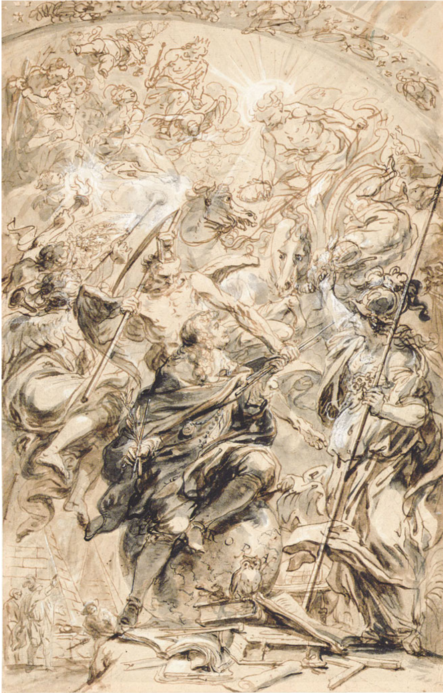
Abb. 1: Apotheose Joachim von Sandrarts: Zeichnung von Michael Willmann in Braun, Grau und Schwarz, Feder und Pinsel, laviert, Weißhöhung, auf gelbem Papier, 1682, Wien, Albertina, Inv. Nr. 3567/1.