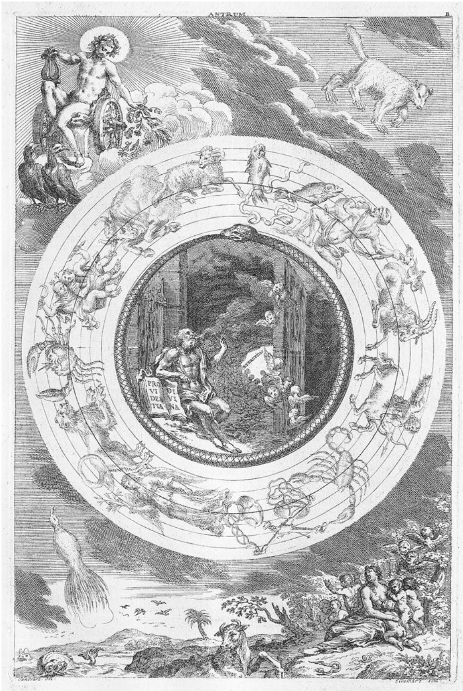
Abb. 12: Die Höhle der Ewigkeit: Kupferstich von Joachim von Sandrart, Tafel B. in der „Iconologia Deorum“, Nürnberg 1680.