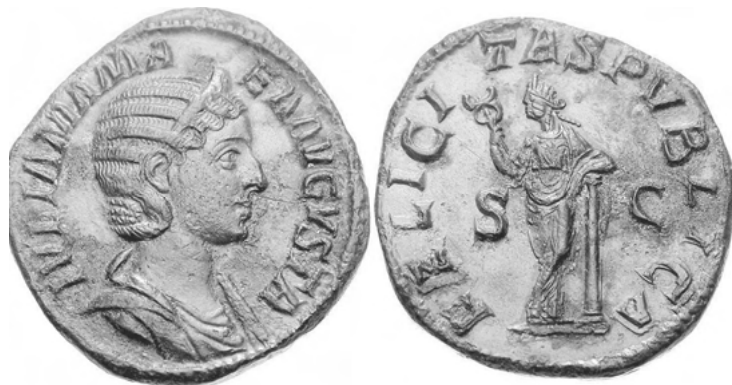
Abb. 10a Sesterz für Julia Mamaea, Rom, 228 n. Chr., Rückseite: Personifikation im ikonographischen Schema der Securitas, Legende: FELICITAS PVBLICA, Privatsammlung