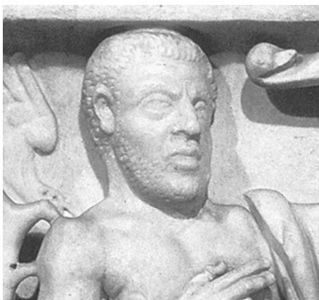
Abb. 5a und 5b Frontrelief eines Herkules-Sarkophages, um 240 n. Chr., Detail des Verstorbenen als Her- kules im Zyklus der Taten des Helden, Rom, Palazzo Altemps

Für den hier angesprochenen Kontext scheint es mir allerdings ohnehin relevanter, vor der Folie dieser Skizze noch einmal auf die bereits eingangs gestellten Fragen zurückzukommen, inwieweit und ob überhaupt die in den originären Legenden vorgestellten Heldenkonzepte in solchen imitationshaft erscheinenden Adaptationen eine Rolle spielten. Widmet man zunächst der Auswahl der auf den Sarkophagen wiedergegebenen Mythen Aufmerksamkeit, so wird nämlich rasch offensichtlich, dass diesen in erster Linie lediglich die Aufgabe zukam, auf eine eher diffuse, wenn auch durchaus pragmatische Weise der unmittelbaren Funktion der Bildträger Rechnung zu tragen, indem sämtliche der dort zitierten Legenden – mit von Fall zu Fall variierenden Schwerpunkten – von Tod, Schmerz, Verzweiflung, ewiger Liebe und Trost handelten und/oder Visionen eines glücklichen Zustands eines ‚Danach‘ im Kreis der Götter heraufbeschworen. 14 Was die handeln