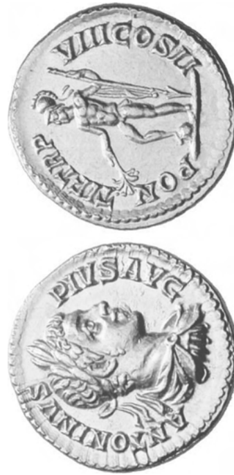
Abb. 9c Aureus des Caracalla, Rom, 211 n. Chr., Rückseite: Der Kaiser setzt seinen Fuß auf einen unterworfenen Barbaren, Privatsammlung