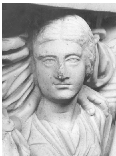
Abb. 2a, 2b und 2c Frontrelief eines Adonis-Sarkophages aus dem ‚Pankratiergrab‘, um 220 n. Chr., Rom, Musei Vaticani, Inv. Nr. 10409

narrativen Stoff der Legende in Erinnerung, so kommuniziert das Bild mit gänzlich anderen Schwerpunkten. Denn der Abschied der Liebenden, im sepulkralen Kontext Anspielung auf den abschiedlichen Tod, und die dramatische Jagd des Adonis als Sinnbild der mutigen männlichen virtus dienen, im Kontrast zu deren sonst geläufigen bildlichen Schilderungen, hier lediglich als Rahmenszenen für eine auch proportional deutlich prominentere Darstellung im Zentrum. Dort sitzt