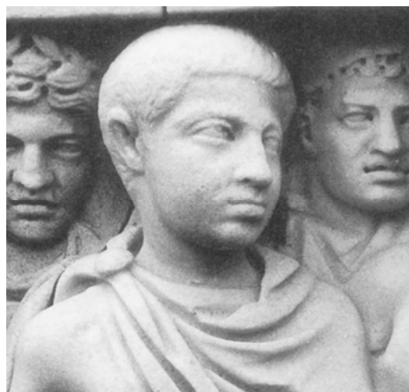
Abb. 7a, 7b und 7c

Frontrelief eines Theseus-Sarkophages, um 240/250 n. Chr., wohl aus Rom, Cliveden (Buckinghamshire), Sammlung Astor