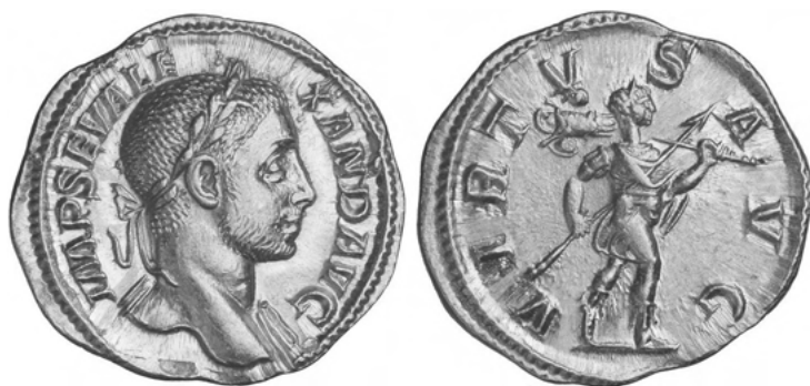
Abb. 10b Aureus des Severus Alexander, Rom, 228 n. Chr., Rückseite: Romulus mit Tropeum, Legende: VIRTVS AVGVSTI, Privatsammlung

siedelte distanziert-gedankliche Ebene, auf der sich solche Bilder bewegen konnten, noch zusätzlich deutlich.