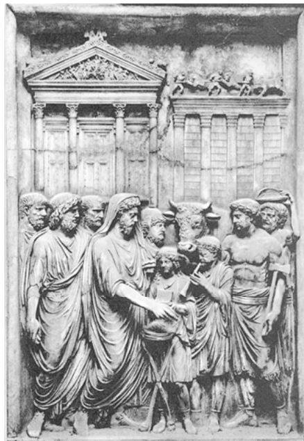
Abb. 3b Opfer vor dem Tempel des Iuppiter Capitolinus ( pietas und constantia )

Reliefs von einem Staatsmonument des Marc Aurel, welches nach seinem Triumph über die Germanen und Sarmaten 176 n. Chr. errichtet wurde, Rom, Musei Capitolini