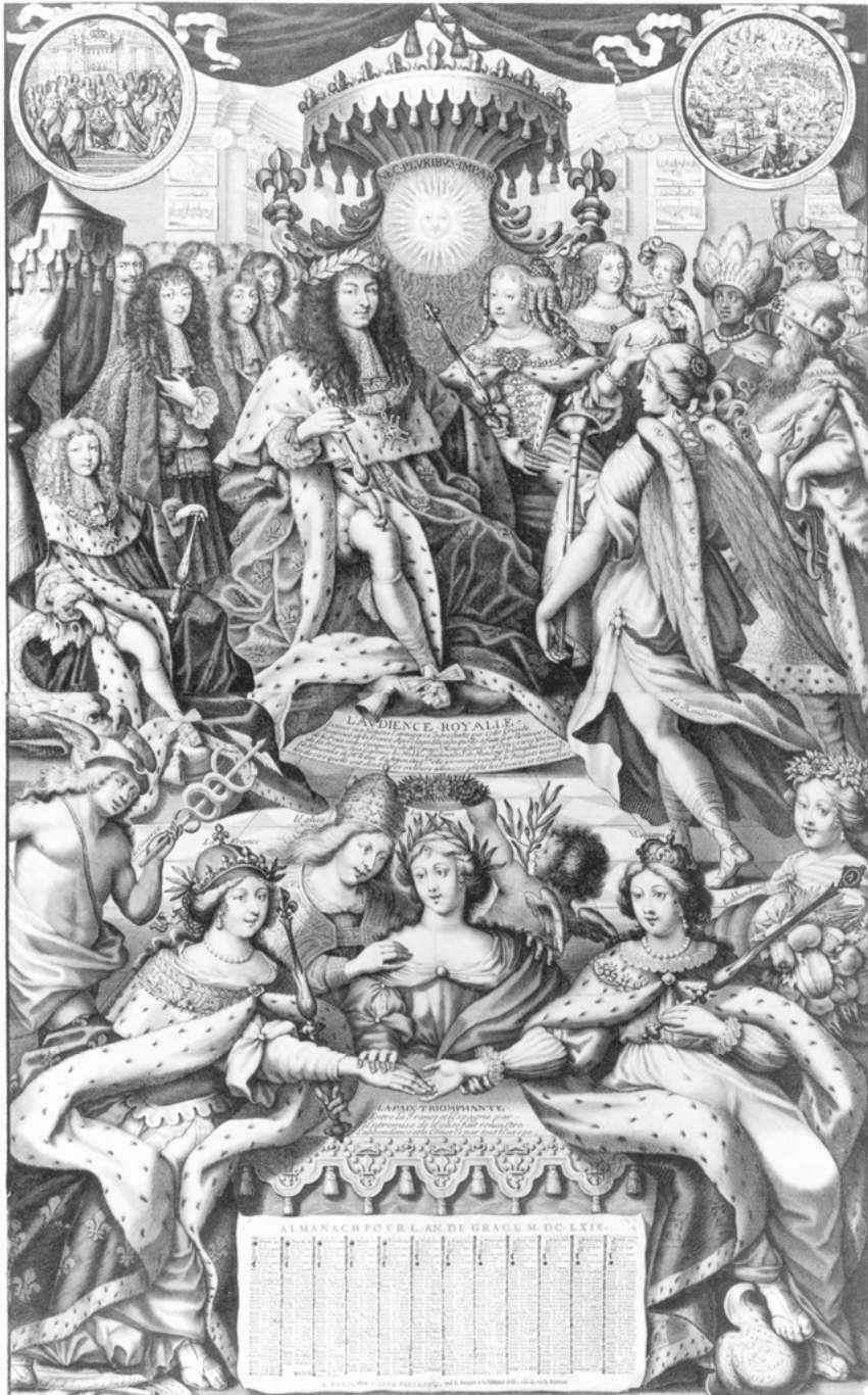
Fig. 5 Almanach 1669, burin et eau-forte, 84,8 × 52,8 cm, Paris, Musée du Louvre