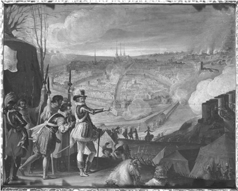
Fig.1 Henri IV au siège d'une ville, huile sur toile, Chartres, Musée des Beaux-Arts