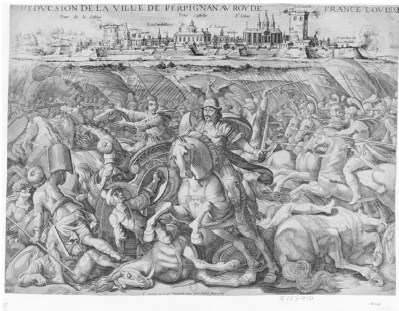
Fig. 2 Réduction de la ville de Perpignan au roi de France Louis XIII, gravure, Paris, Bibliothèque nationale de France